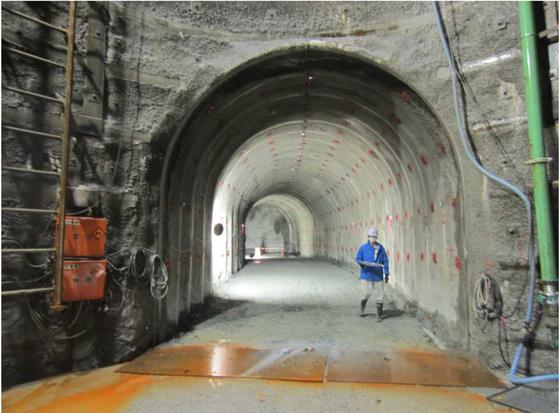
(4)転流工：仮排水トンネル（R3年10月撮影）