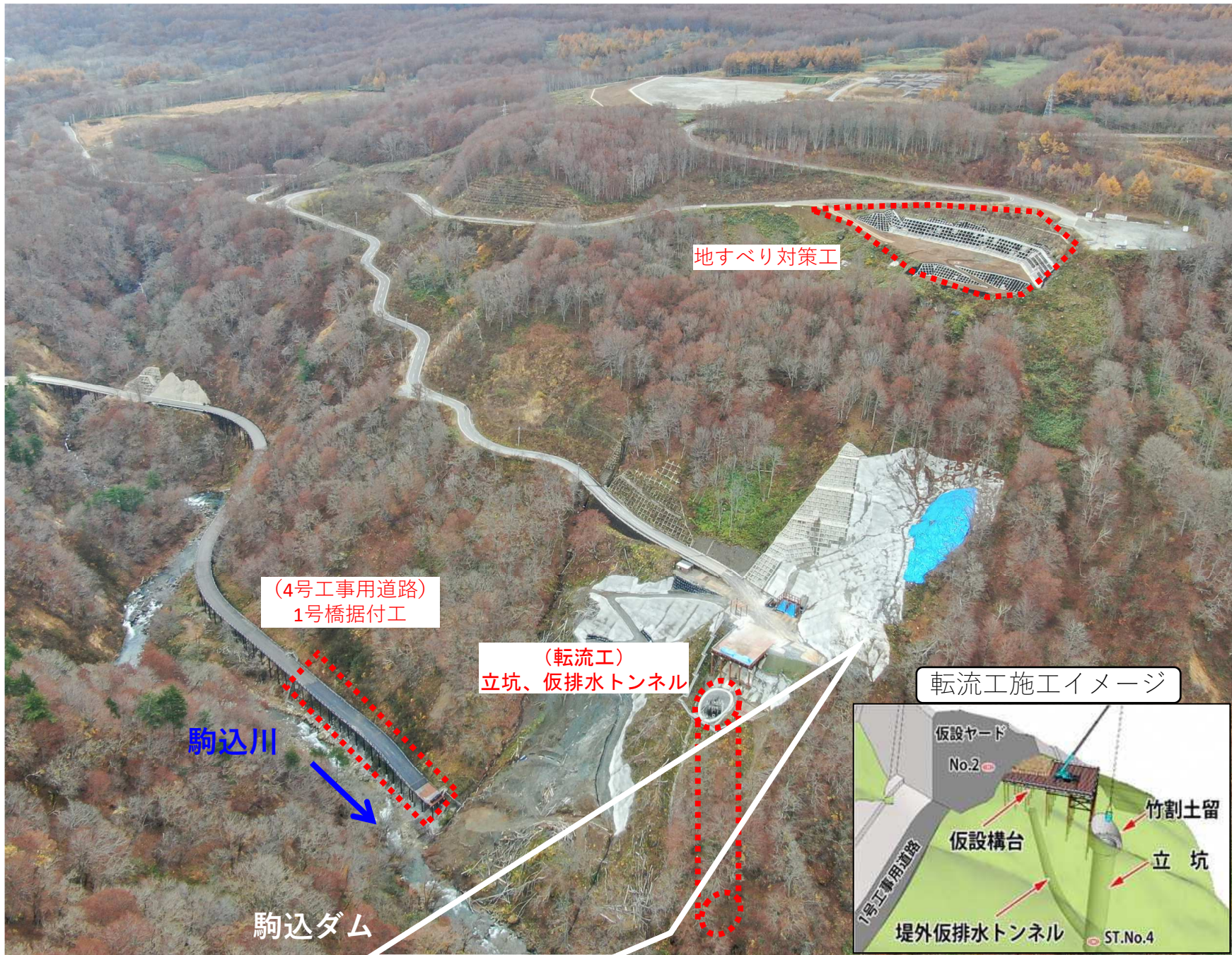
(1)ダム建設予定地全景 (R3年11月撮影)