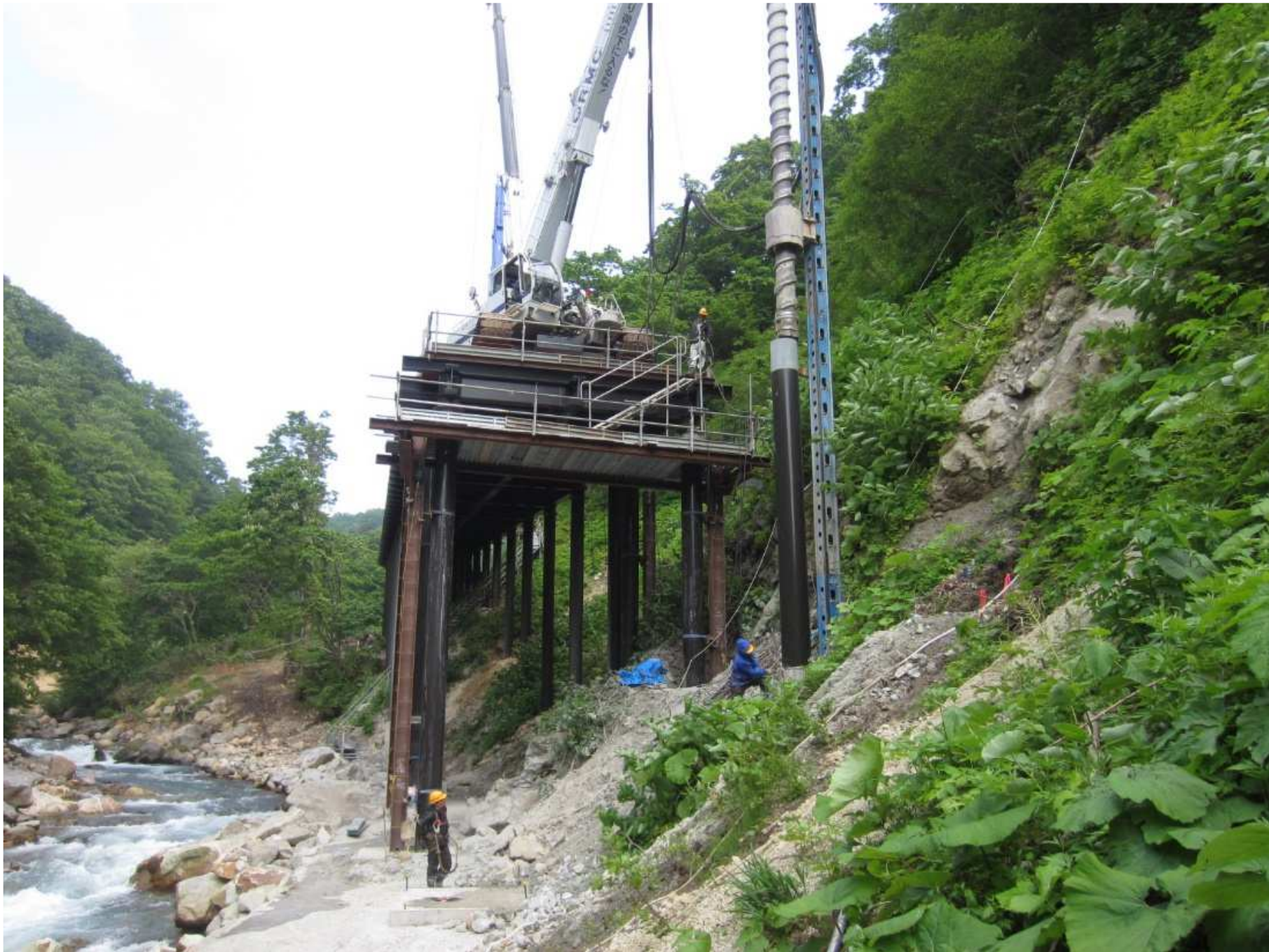
(7)4号工事用道路：1号橋据付工施工状況（R3年6月撮影）