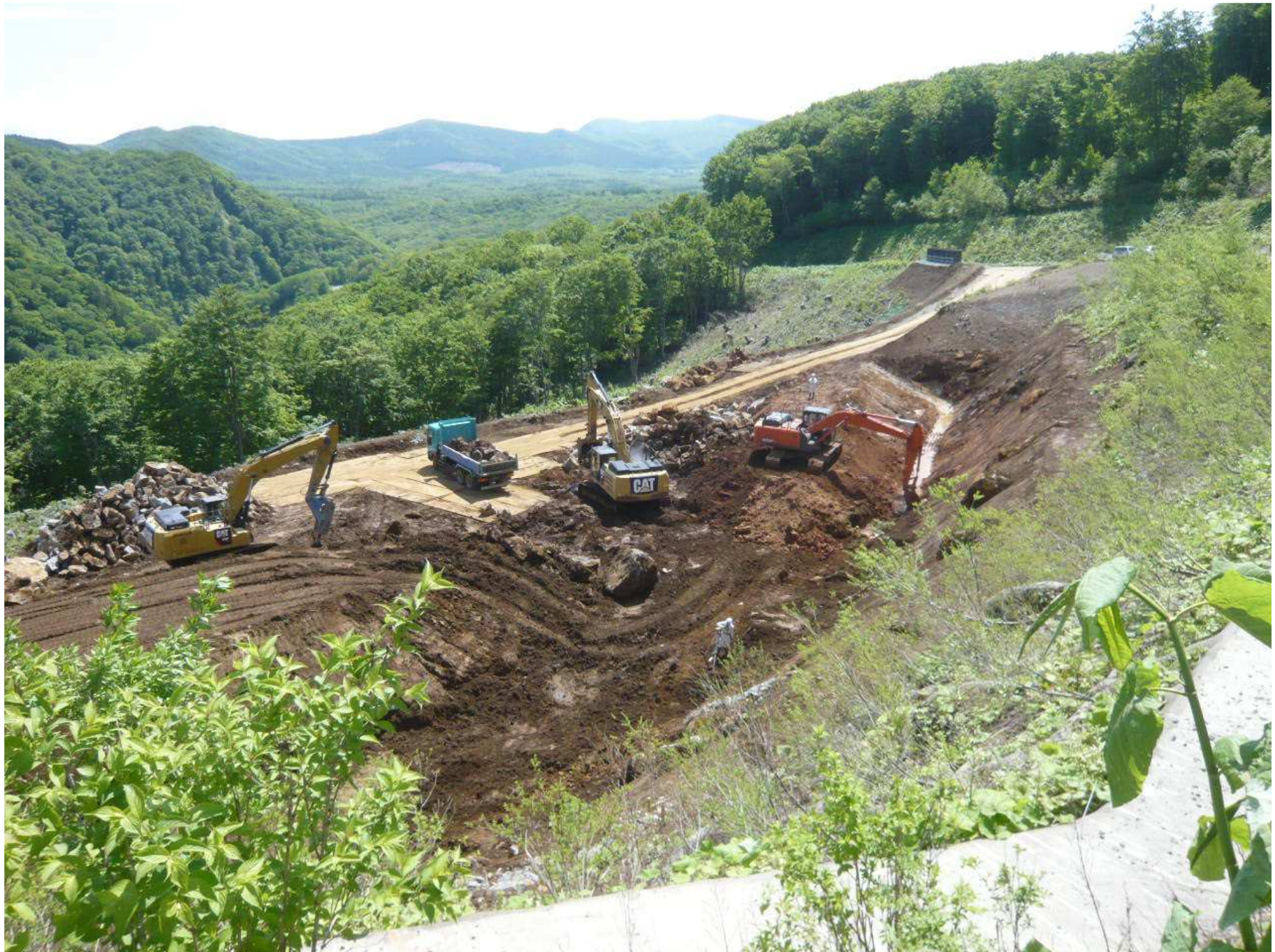
(9)地すべり対策工施工状況 (R3年6月撮影)