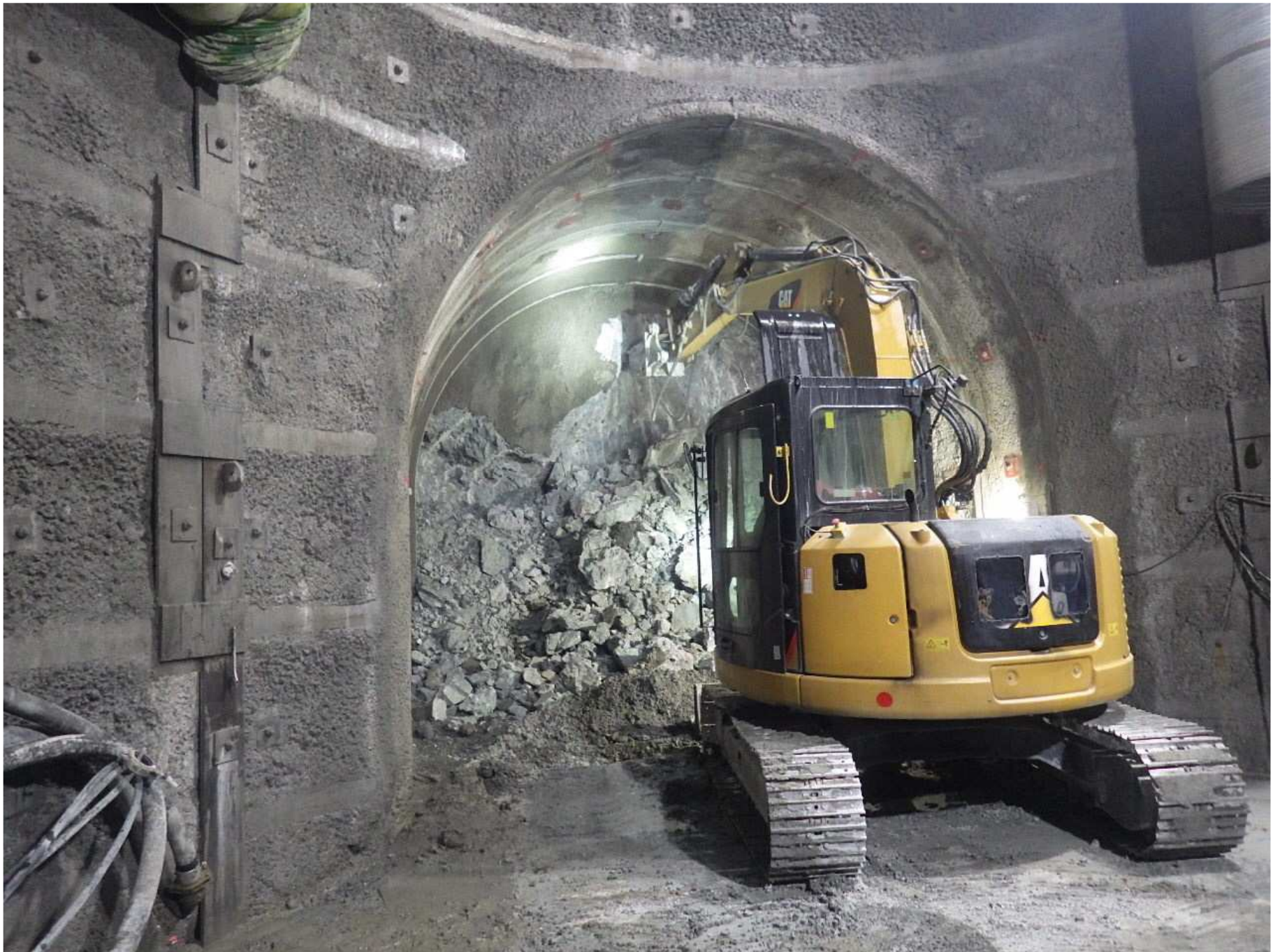
(5)転流工：仮排水トンネル掘削状況（R3年10月撮影）