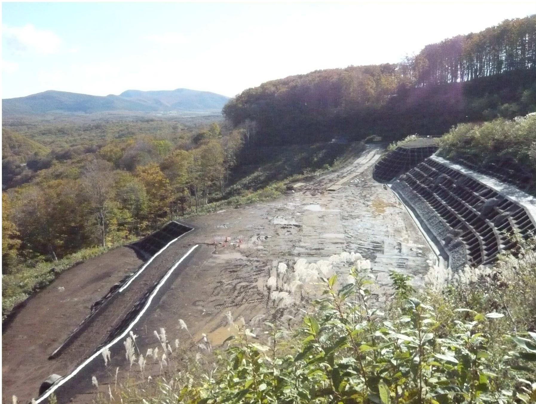
(8)地すべり対策工 (R3年10月撮影)