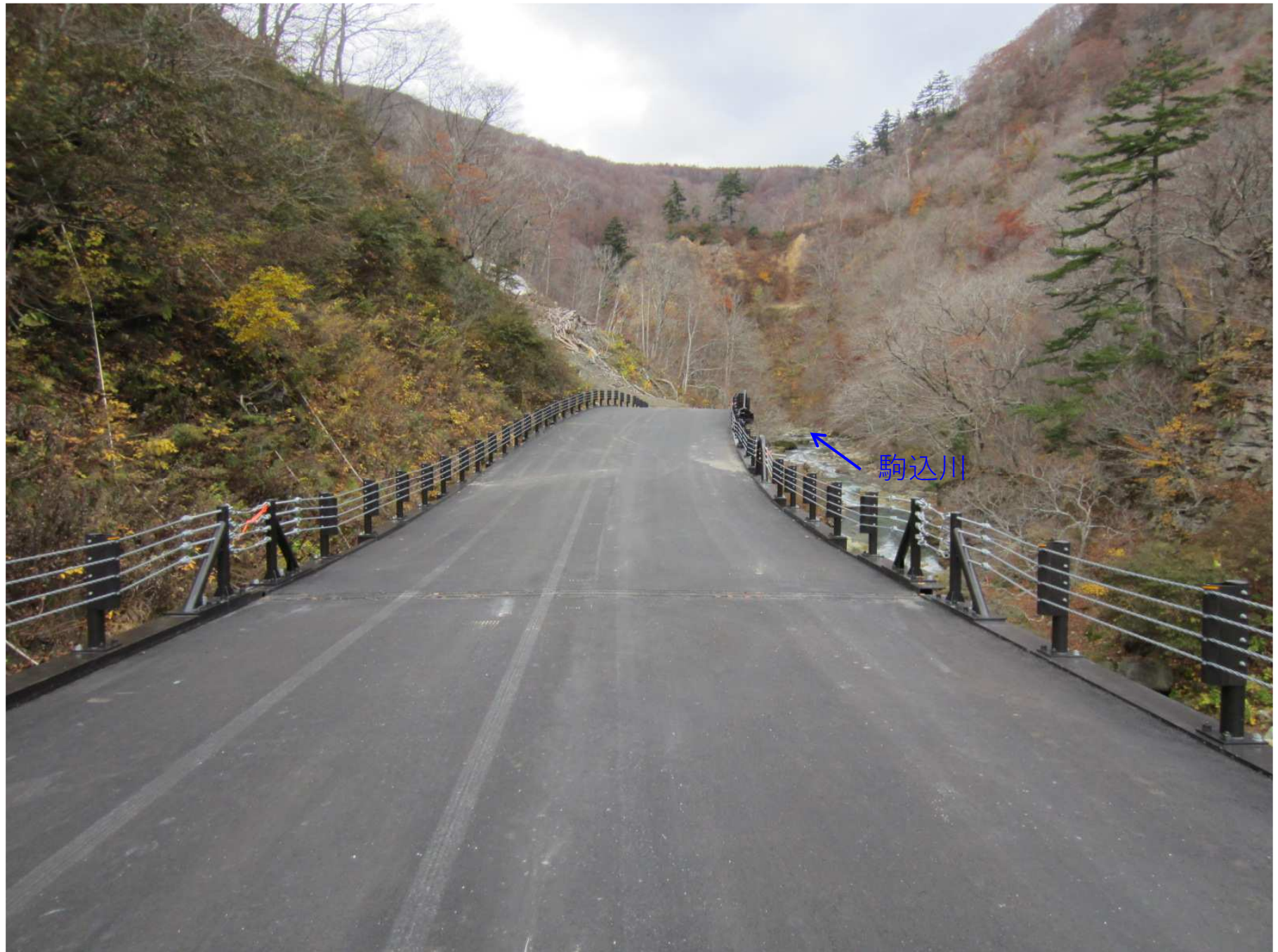
(6)4号工事用道路：1号橋据付工（R3年10月撮影）