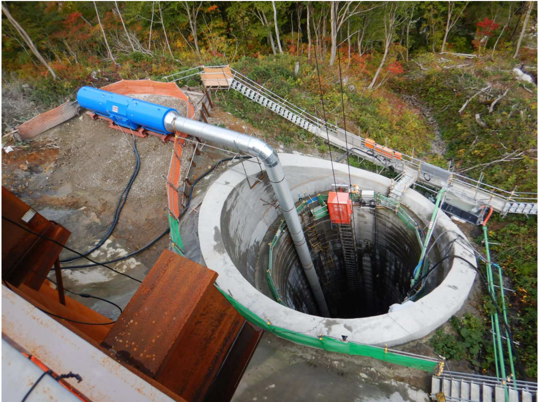
(2) 転流工：立坑上部（R3年10月撮影）