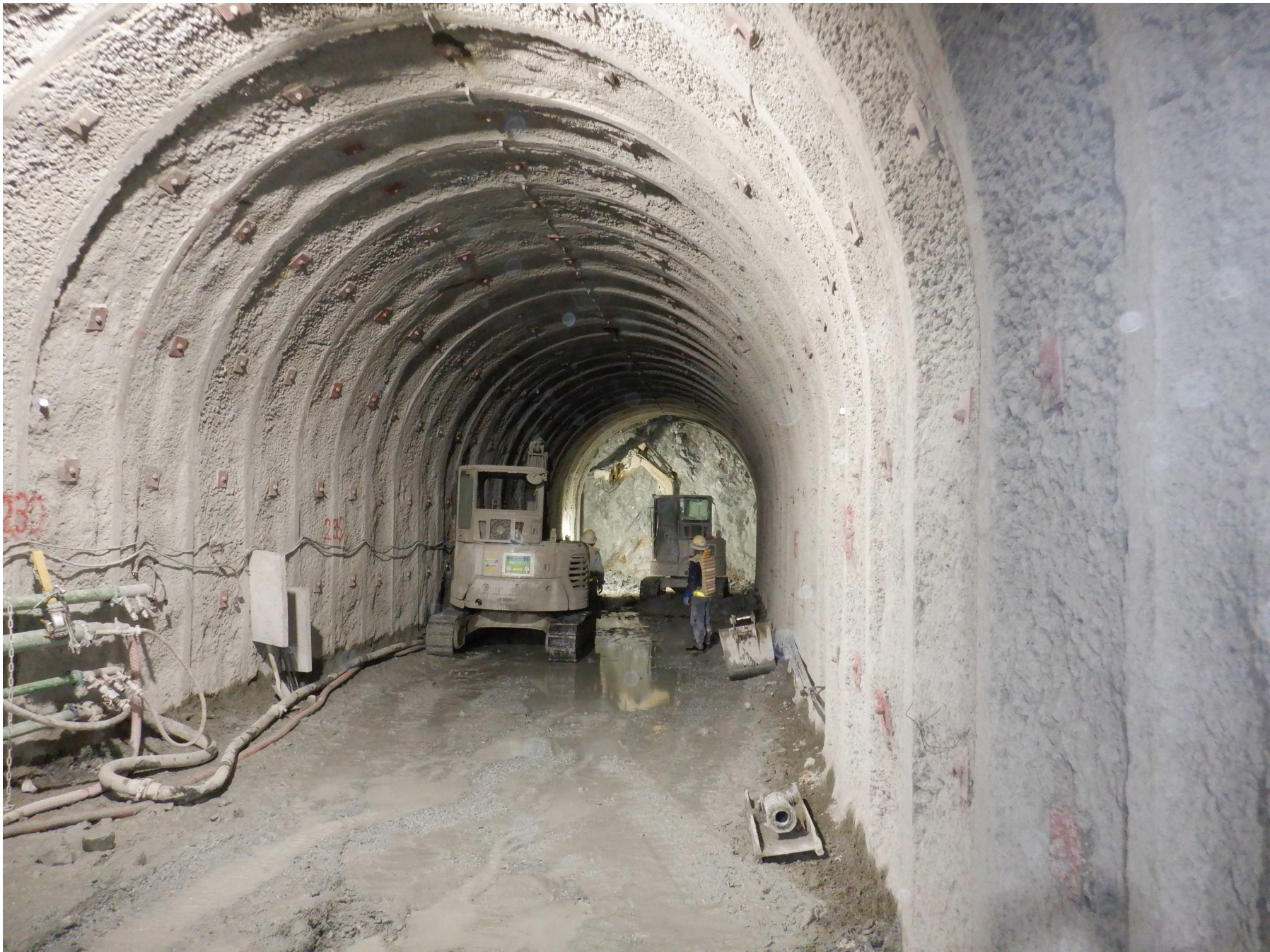
(2)堤外仮排水トンネル施工状況 (R4年10月撮影)