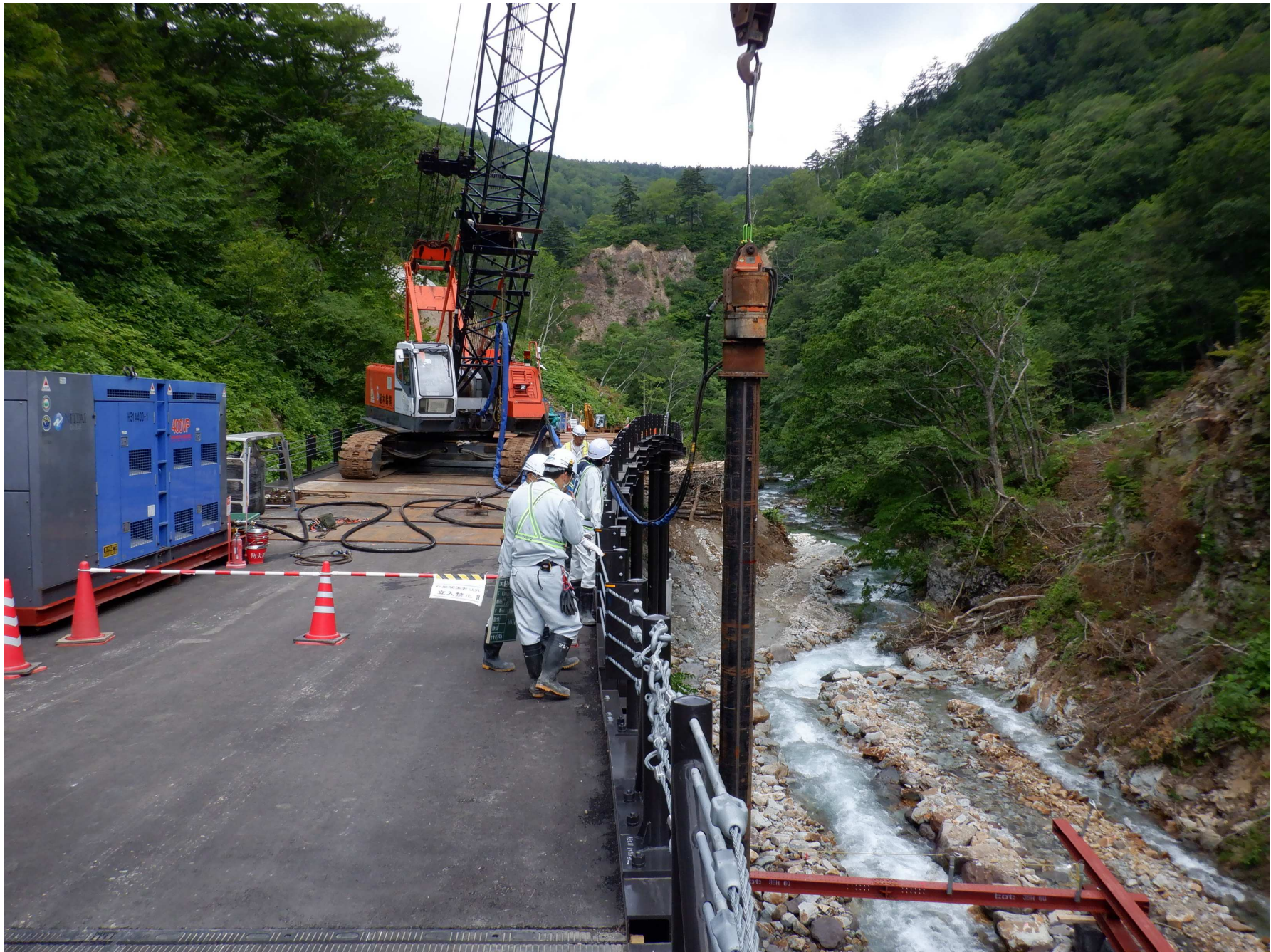
(8)右岸工事用道路施工状況 (R4年6月撮影)