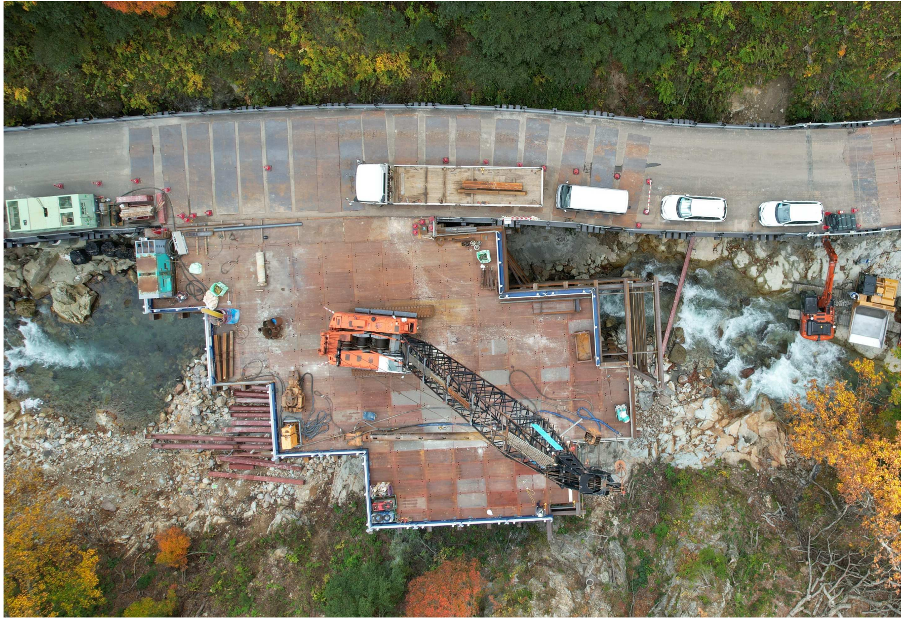
(9)右岸工事用道路(真上から撮影) (R4年10月撮影)