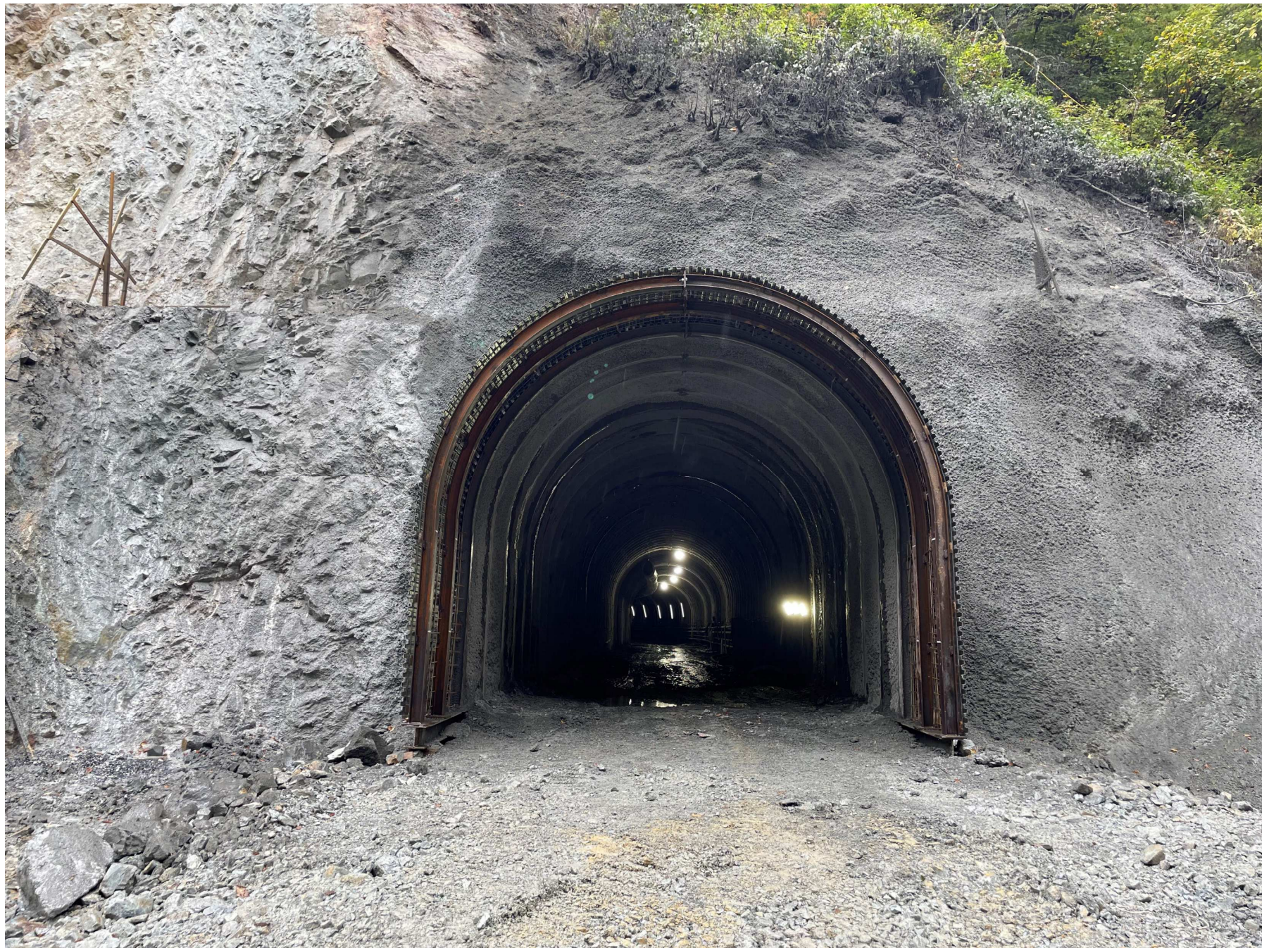
(5)堤外仮排水トンネル吐口部 (R4年10月撮影)