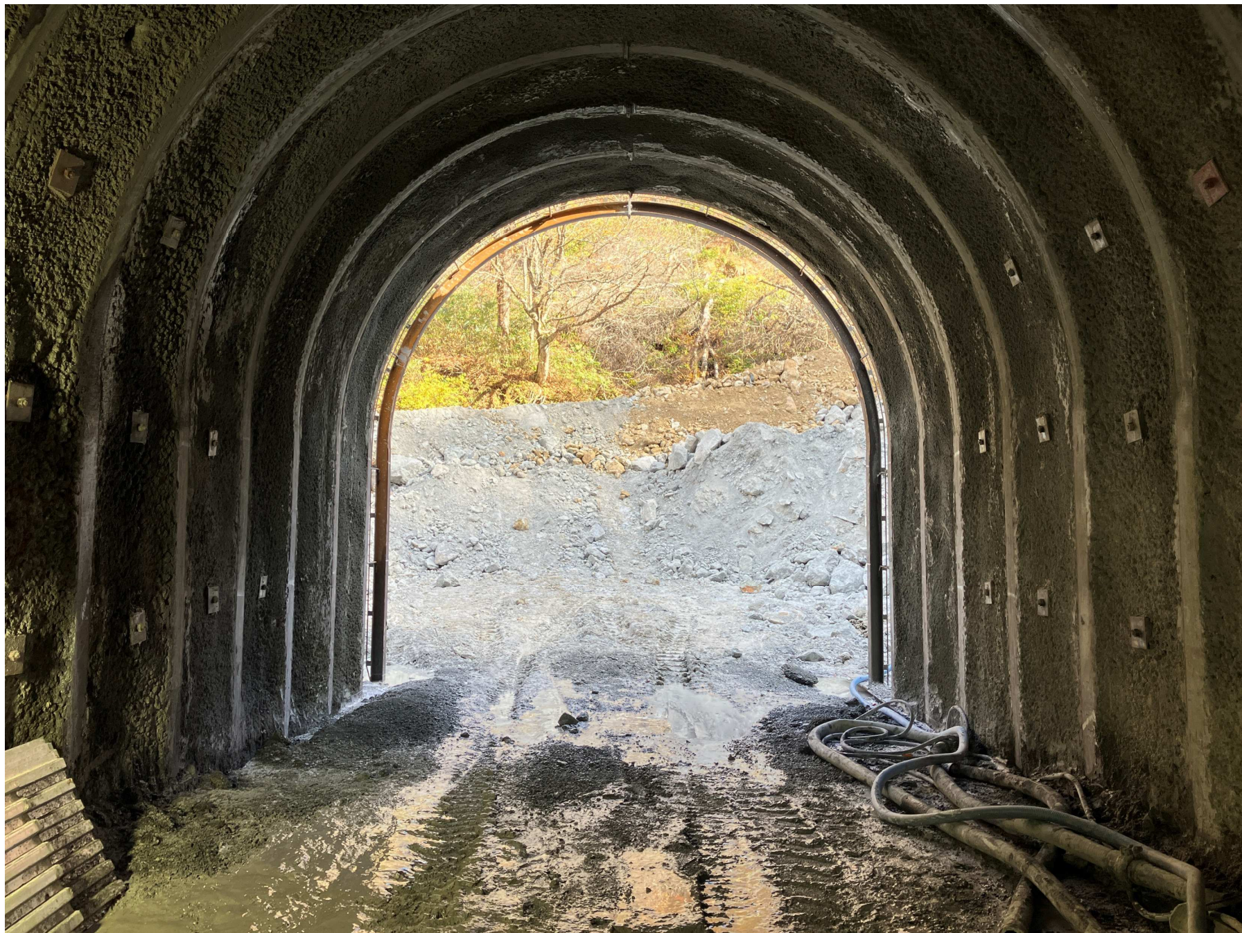
(4)堤外仮排水トンネル呑口部 (R4年11月撮影)