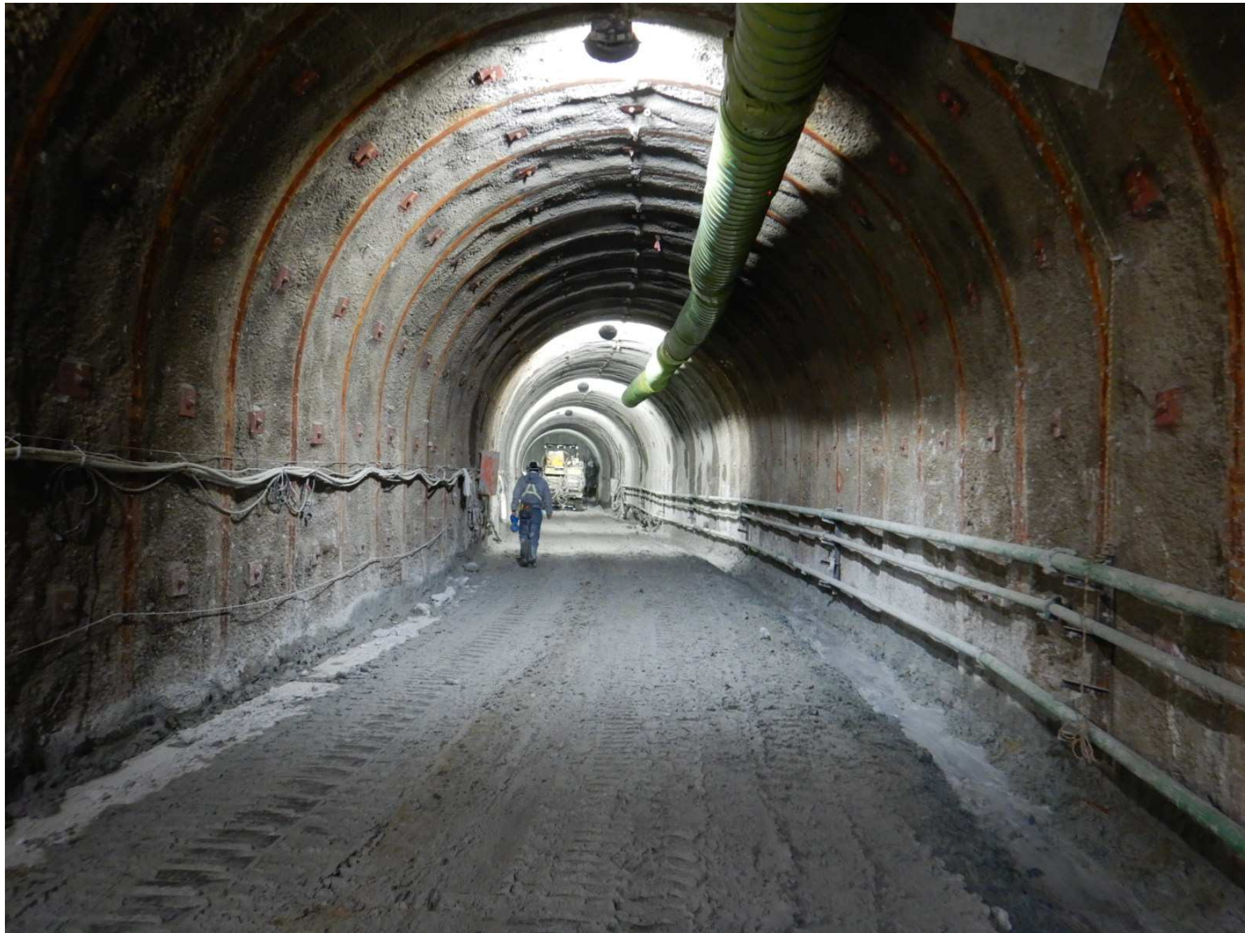
(3)堤外仮排水トンネル (R4年10月撮影)