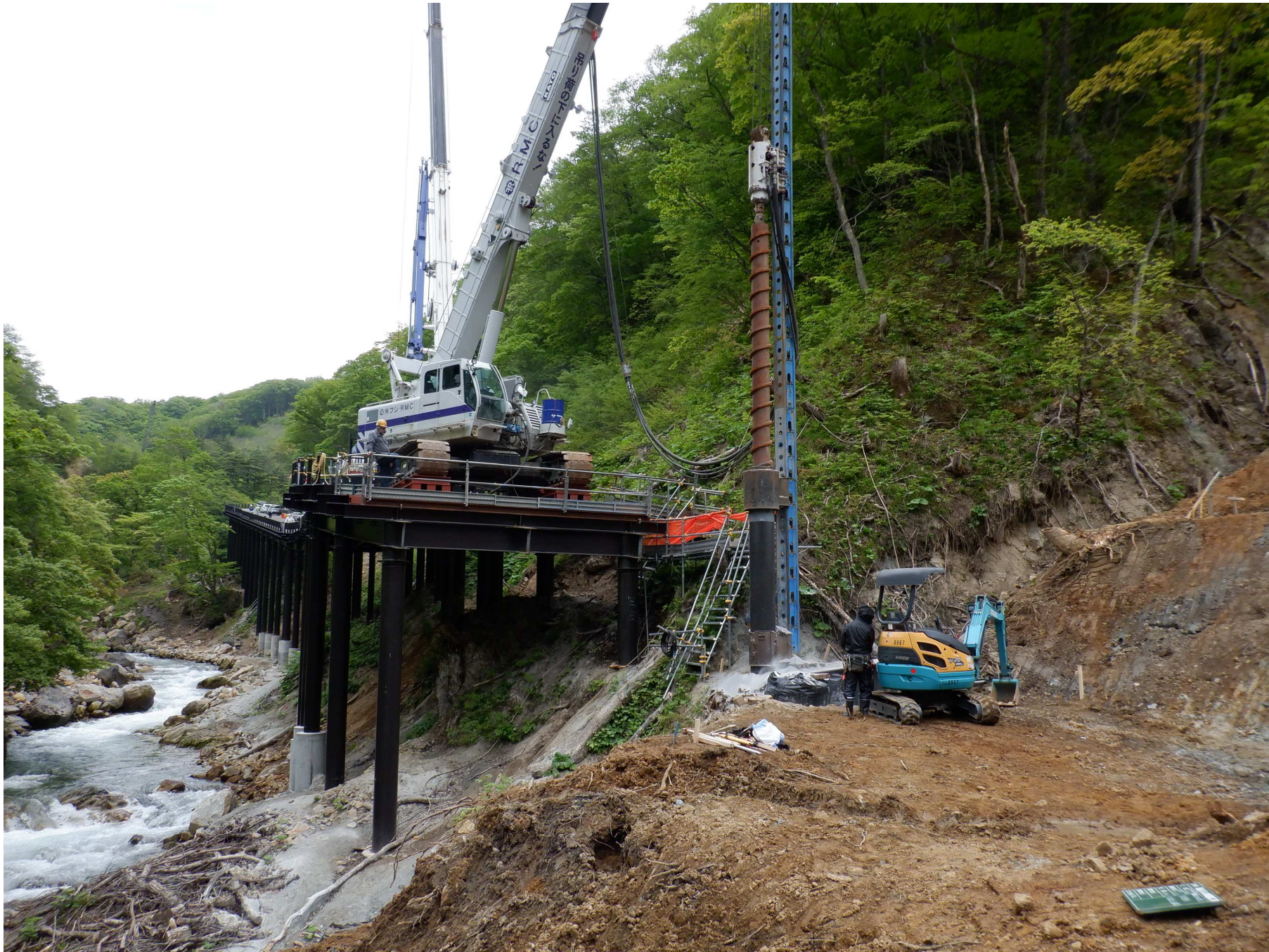
(6) 4号工事用道路施工状況 (R4年6月撮影)