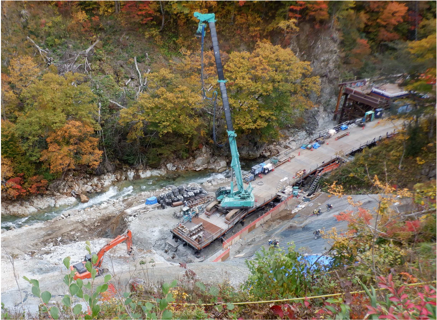
(7) 4号工事用道路 (R4年10月撮影)