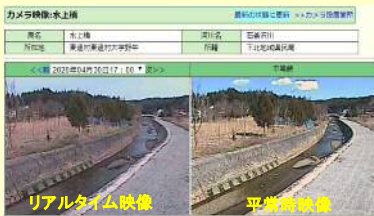
「青森県河川砂防情報提供システム」カメラ映像 URL: http://www.kasensabo.bousai.pref.aomori.jp/