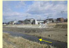
【奥戸川】奥戸橋上流(R1施工箇所)