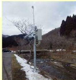
簡易型河川監視用カメラ