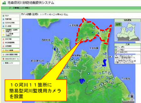
河川監視カメラ設置箇所