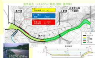
事業概要図(奥戸川総合流域防災事業)