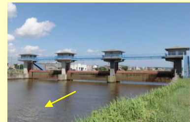
【新田名部川】潮止堰