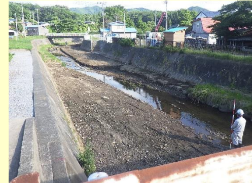
小川代川掘削状況