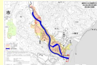
浸水想定区域図（脇野沢川）