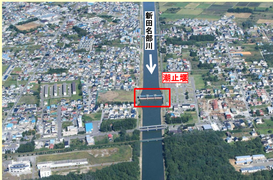
新田名部川周辺航空写真