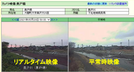
リアルタイム映像 奥戸川（奥戸橋）