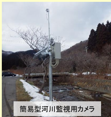
簡易型河川監視用カメラ