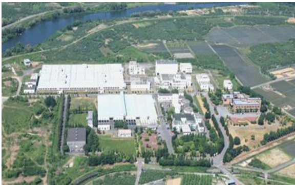
岩木川浄化センター（弘前市） （昭和62年供用開始）

工業用水道施設の機能を確保するため、設備の修繕工事を発注するなど、施設の運営・維持管理に関する業務を担当します。