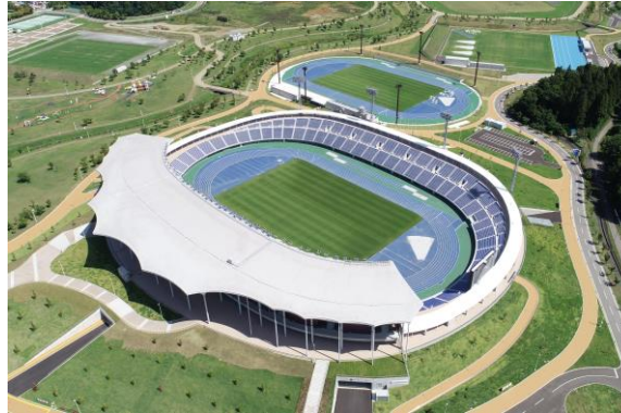
新青森県総合運動公園陸上競技場（平成30年竣工）