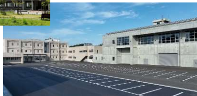
青森県消防学校改築工事