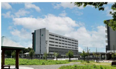
県営住宅小柳団地建替事業