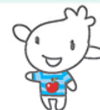
青森空港キャラクター ひこりん