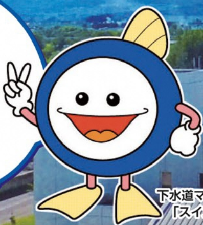
下水道マスコット 「スイスイ」