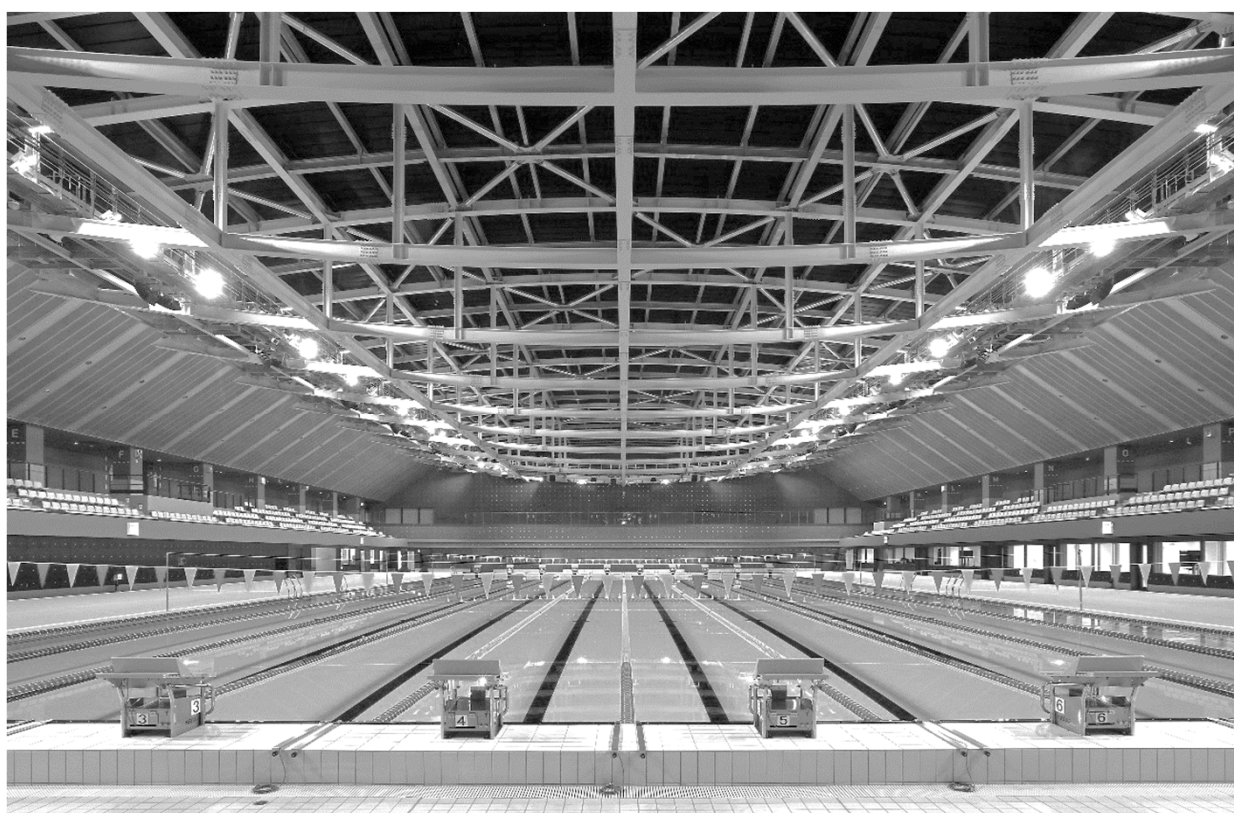
新青森県総合運動公園 マエダアリーナ50メートルプール