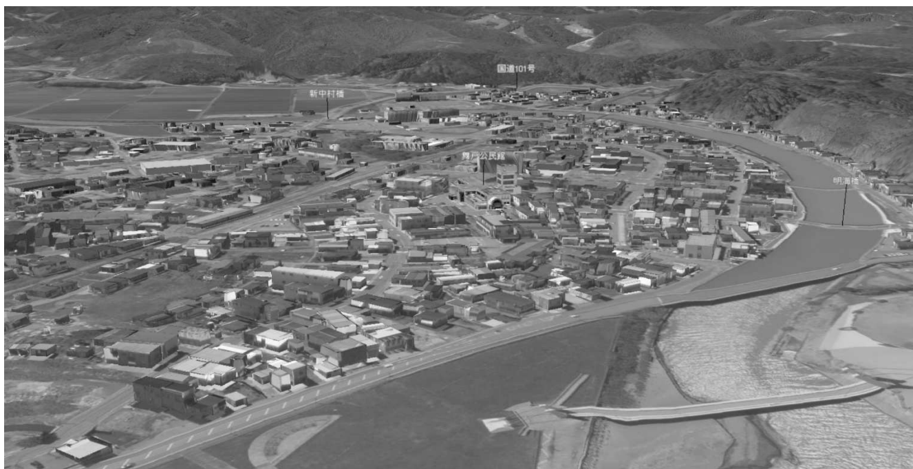
鱒ヶ沢町 3D都市モデル(Project PLATEAU) 令和7年度 都市空間情報デジタル基盤構築支援事業