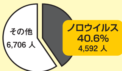
原因別の食中毒患者数（年間）