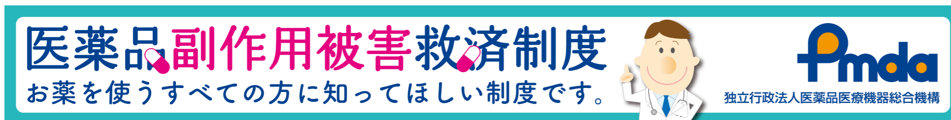
②ビッグバナー / 左右 728pix × 天地 90pix