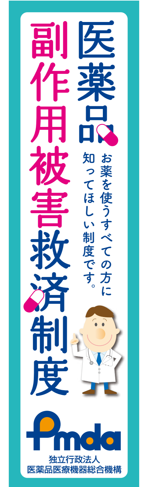
④ワイドスカイスクレイパー / 左右 160pix × 天地 600pix