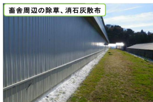
畜舎周辺の除草、消石灰散布