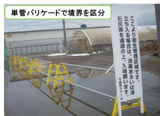
単管バリケードで境界を区分