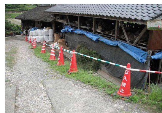
工食用カラーコーンで境界を区分した事例