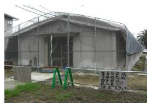
鶏舎全体を防鳥ネットで覆った事例 (ファスナー開閉による入退出)