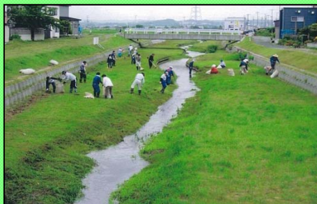
刈り払い機による除草作業