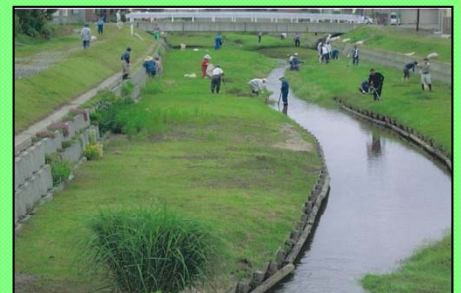
きれいになった河川敷