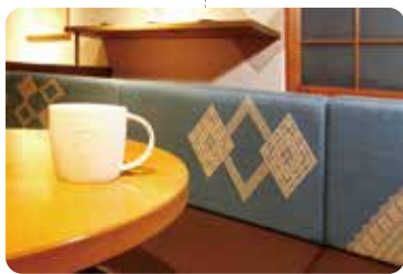
小巾刺繡與洋館相得益彰 [星巴克弘前公園前店]