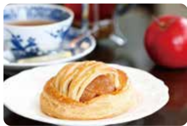
蘋果派超好吃 [大正浪漫茶室]