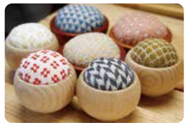
邂逅青森縣內外藝術家的作品 [津輕工房社]