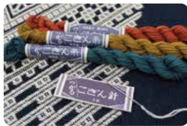
原創布料、針線等品類豐富 [手工商店 TSUKIYA]