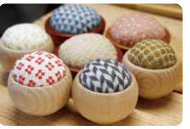
아오모리현 내외의 작가의 작품을 만날 수 있다 [쓰가루 공방]