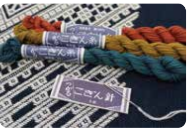
오리지널 천바늘선이 풍부하다 [아이템 숍 쓰키야]