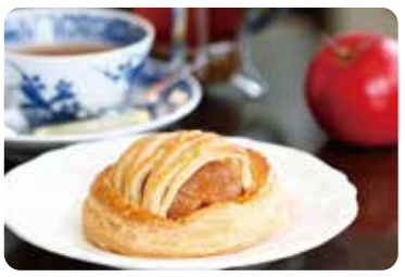
애플파이가 맛있다 [다이쇼 낭만다방]