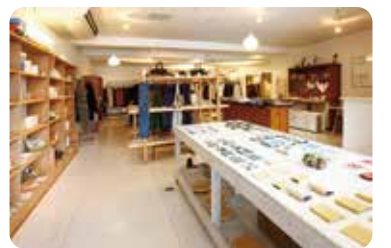
현대적이고 귀여운 코긴자수 [그린]

코긴자수의 역사를 공부하고 싶은 분에게 메이지(약1800년 쯤) 시기의 「옛 작품」을 접하고 코긴자수 도구를 구매할수있는 사토요코 코긴전시관을 추천합니다. 여기저기의 가게에는 현대적인 색조의 실과 천으로 누빈 명함집 또는 파우치등 아기자기한 물건들이 많아서 눈이 쏠리게 됩니다. 걸다가 힘드시면 후지타 기념점원내에 있는 「다이쇼 낭만다방」으로 오십시오. 애플파이를 먹고 비교하면서 「사과의 마을 히로사키」를 충분히 즐기세요.