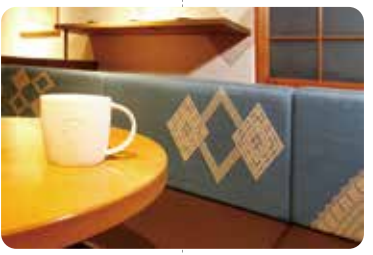
양육에 잘 어울리는 코긴자수 [스타벅스 히로사키 공원앞점]