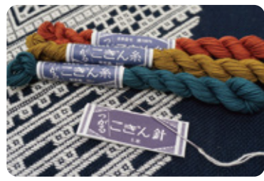
オリジナルの布、針、糸が豊富 【ホビーショップ つきや】