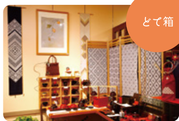
職人手づくりの工芸品が並ぶ 【とて箱】

風雪吹き荒れる冬の津軽で、少しでも暖かく過ごせるように。江戸の頃から津軽の女たちは家族のため一心に、藍色の麻布に白い木綿糸を刺し続けました。横一線だった針の目はやがて、凛とした美しさを備える菱形模様となり、「こぎん刺し」と呼ばれるようになりました。 仕事着を保温、補強し、飾った頃から綿々とながれた針の軌跡は、「制約の中で生まれた慎ましい美」として、今も津軽の暮らしのそこそこに点在しています。