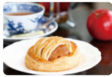
アップルパイが美味しい 【大正浪漫喫茶室】