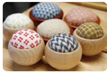
県内外の作家の作品に会える 【津軽工房社】