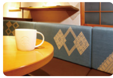
洋館に映えるこぎん刺し 【スターバックスコーヒー弘前公園前店】