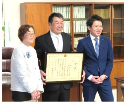
知事に受賞を報告