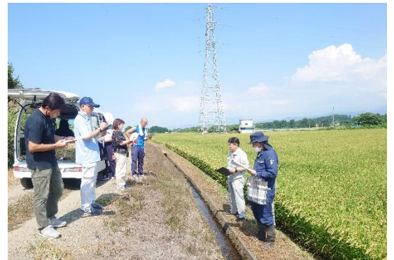
水稲「はれわたり」の高品質生産に向けて

をはじめとして、様々な一般普及指導計画に基づく、これまでの幅広くきめ細かな普及活動に加え、近年の気象変動に対応した農作物の高温対策指導を徹底することにより、安定した 農業所得の確保 と 地域農業の活性化 を図って行きたいと考えていますので、ご協力をよろしくお願いいたします。