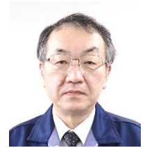
加藤 寿男 経営改善 法人化 農村 RMO