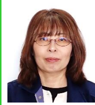
原 綾子 野菜 野菜指定産地 冬の農業