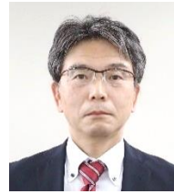
三上 道彦 果樹、りんご 経営安定対策 果樹関係調査