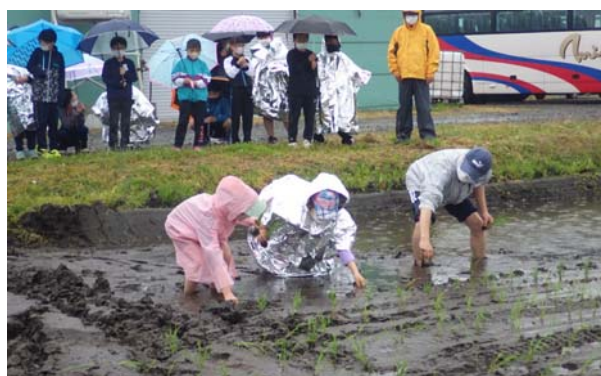
【田植えを行う児童たち】

秋には児童たちが自分たちで田植えしたお米をみんなで収穫作業を行う予定となっています。活動を通して、児童の皆さんには土に親しんで働くことの苦労や生命の大切さを学んでもらえたら何よりです。