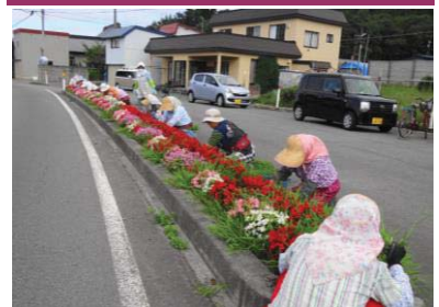
植栽活動 上小国集落協定(外ヶ浜町)