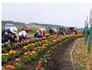
植栽活動 甲地地域水土里保全会(東北町)