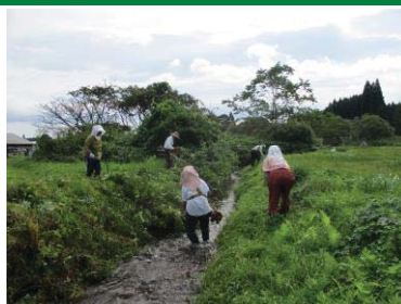
水路の草刈り 上板橋集落協定(東北町)