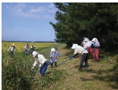
水路の草刈り 土佐保全隊(五所川原市)