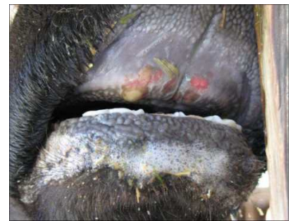
歯床部粘膜のびらん