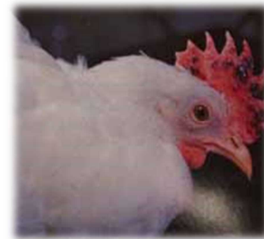
鶏冠・肉垂のチアノーゼ