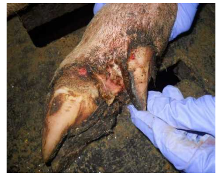
蹄球部皮膚のびらん