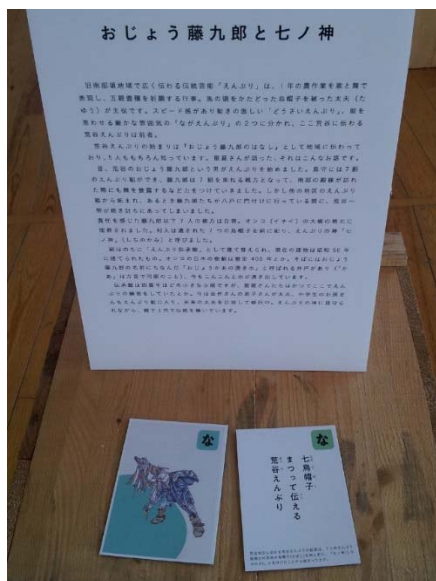
◆歴史や背景についての解説