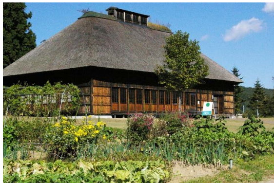
◆茅葺屋根の古民家「館のやかた」

南郷特産の果樹、野菜、山菜などで染めた布を使って作った葉や花などのモチーフが、茅葺屋根の古民家の座敷全体を彩っていました。