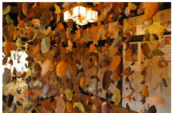
◆アート展示 イメージ「秋」