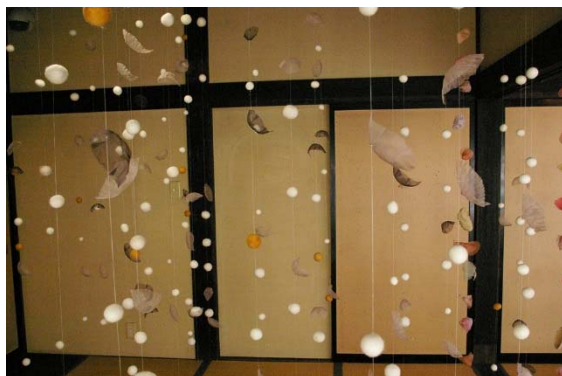
◆アート展示 イメージ「冬」