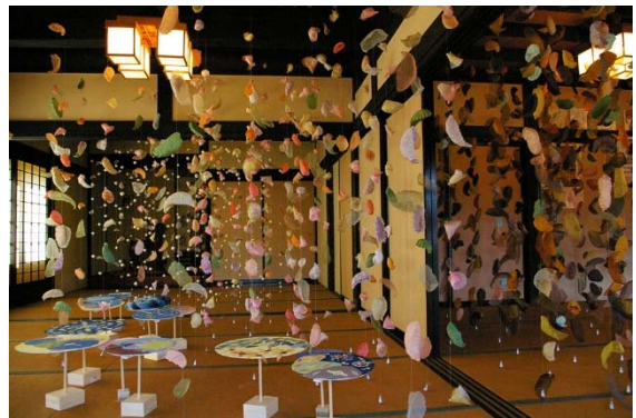
◆座敷のアート展示