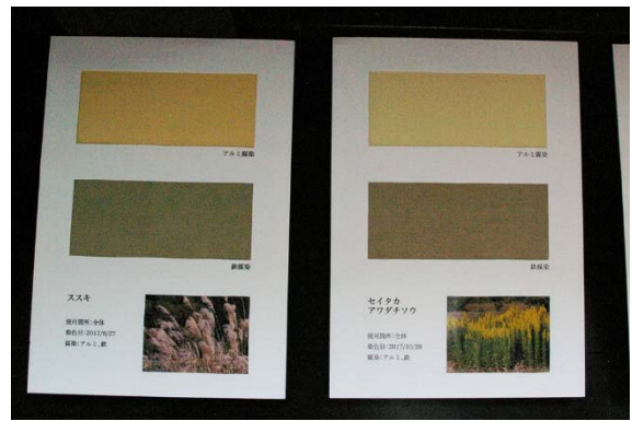
◆南郷の四季折々の植物から抽出した色