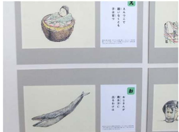
◆「なんごうカルタ」の一部