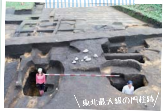
東北最大級の門柱跡

近年の発掘調査において、東北最大級となる1辺45cm×50cmの柱の痕跡が確認されており、巨大な門の存在が伺われます。