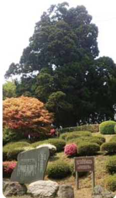
樹齢約千年の 榎杉だよ