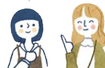
おみやげ たくさん買わなきゃ♪

南部せんべい、りんごジュース等の三戸町の特産品や絵本「11びきのねこ」のグッズが販売されている。地元の食材が味わえる食事処も併設。