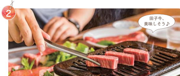
田子牛、 美味しそう♪