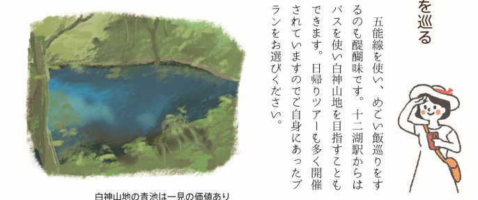
白神山地の青池は一見の価値あり

「奥津軽のめごい飯」とは地域の住民に愛され、地域を象徴するような味や食文化、未来に残したい郷土料理、大衆食堂、地元銘菓で、地域に親しまれている味です。日本海と湖に囲まれた鯨ヶ沢・深浦地域の西海岸はしじみ、もずく、ヒラメといった海産物が豊富に獲れ、めごい飯の宝庫です。また、川魚にも恵まれ、イトウや鮎を扱う店も見られます。世界遺産・白神山地を源流に持つ赤石川の清流水で養殖されたイトウ。川のトロとも呼ばれ、淡白でクセのない口当たりは、どのような料理、お酒とも相性抜群です。西海岸に足を運んだ際は、海産物、川魚などの地域ならではの素材を使った郷土料理をご堪能ください。