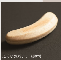
ふくやのバナナ (最中)