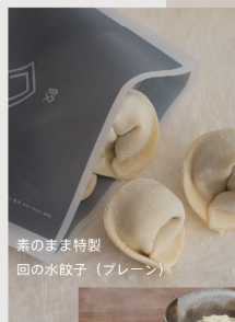
素のまま特製 回の水餃子 (プレーン)