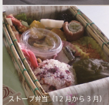
ストープ弁当 (12月から3月)

津軽鉄道では鉄道ファンのために、季節の駅弁を販売しております。三日前までに2個以上で要予約。津軽鉄道に乗りながら予約弁当を食べるのは風情がありますね。