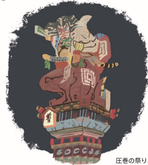
庄巻の祭り、五所川原立佞武多

初夏の時期には太宰治の好物を詰めた「たざい弁当」が登場します。三日前までに2個以上で予約を承ります。詳しくは津軽鉄道のホームページをご覧ください。