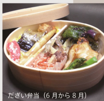
たざい弁当 (6月から8月)