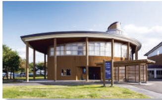
⑥むつ市海と森ふれあい体験館