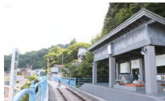
③大間鉄道アーチ橋「メモリアルロード」