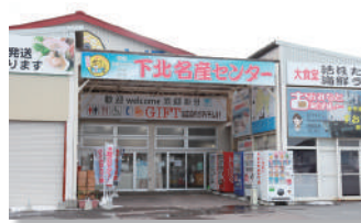
⑦下北名産センター