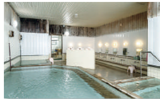
⑦スパウッド観光ホテル