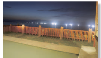
④桑畑温泉「湯ん湯ん♪」