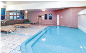
⑤おおま温泉海峡保養センター