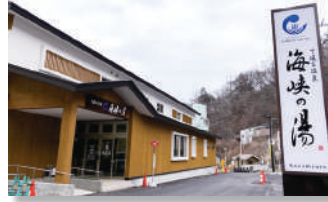
③下風呂温泉「海峡の湯」