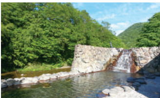
①奥薬研修景公園レストハウス