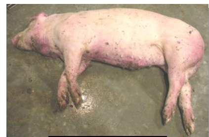
急死豚にみられた全身のチアノーゼ

症状:食欲の減退、41～42℃の発熱。元気不振。沈うつ。結膜炎による目やに。便秘や下痢。後軀麻痺などの神経症状を呈し、末期には体表に紫斑(チアノーゼ)が見られる。異常産の発生も見られる。