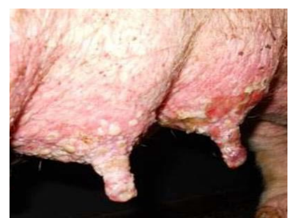
乳房、乳頭の水疱、 びらん、痂皮