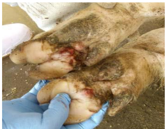
蹄球部皮膚のびらん、潰瘍

口の中、唇、鼻、蹄、乳房の いずれかに 水疱、びらん、潰瘍 または痂痕がみられる。