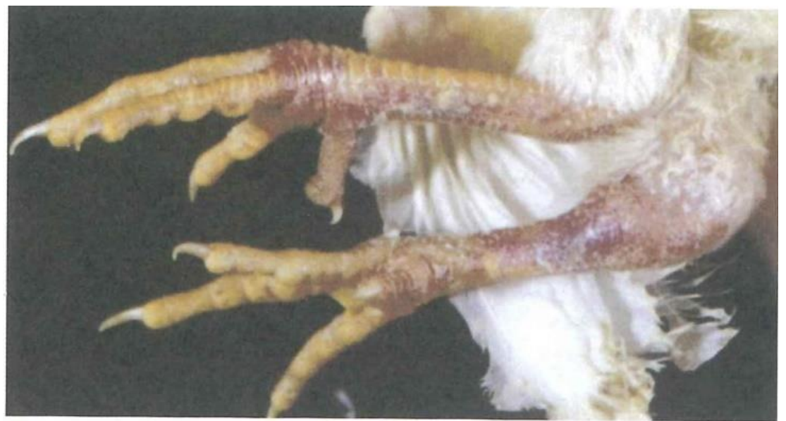
写真3. 脚部の皮下出血（真瀬昌司・谷村信彦原画）