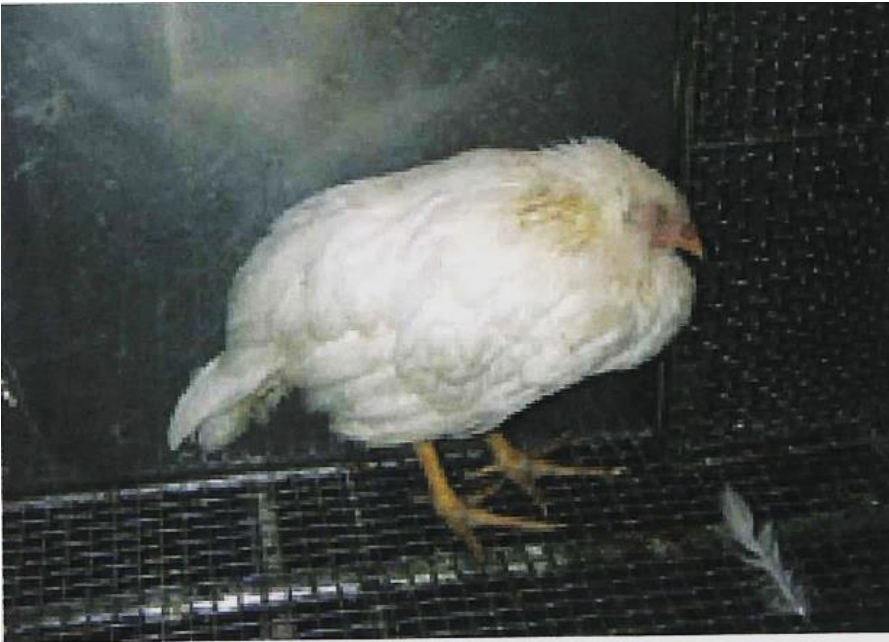
写真1. 感染し、元気をなくした鶏（真瀬昌司原画）