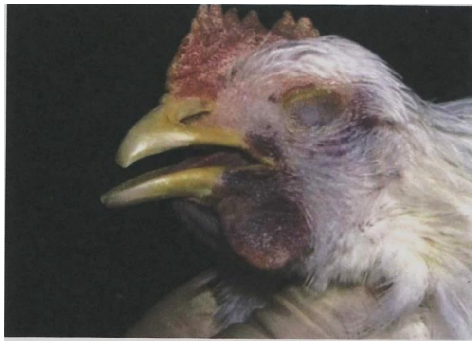
写真4. 宮崎株実験鳥 肉垂のチアノーゼが見られる