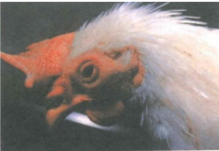
写真2. 突然の沈うつ、すぐ死亡