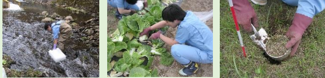
河川水の採取 農産物の採取 土壌の採取