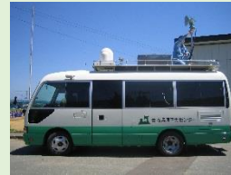
モニタリングカー (車を使った走行測定)