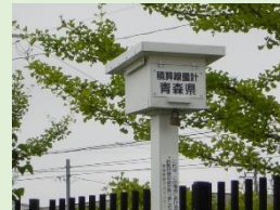
モニタリングポイント (3か月間の積算線量を測定)