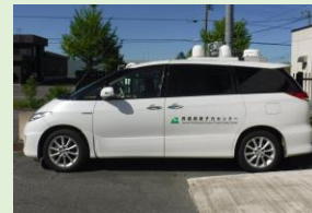
モニタリングカー (車を使った走行測定)