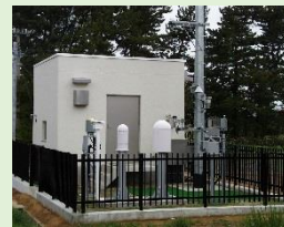
モニタリングステーション モニタリングポスト (空間放射線量率を連続測定)