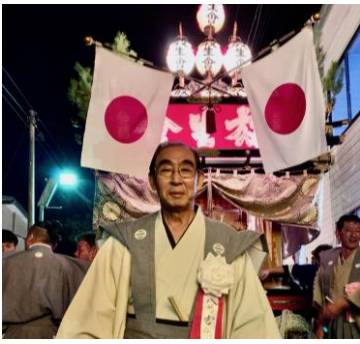
2023年の「大畑八幡宮例大祭」にて