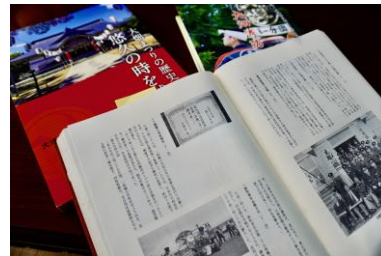
主な著書は『大畑消防団史』『大畑まつりの歴史 悠久の時を越えて』など

また、私は歴史好きで、調べたことを編集することも好きです。これまでの人生で得た知識、経験を次の世代につなげたい。そんな想いで、現役時代から執筆・編集活動も行っています。