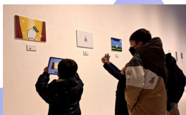
青森県立美術館での開催の様子 (R6.2.3~2.11開催)