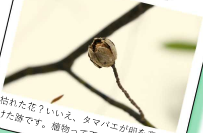
クロモジの虫こぶ