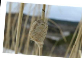
オオカマキリの卵