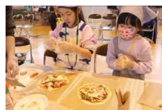
チーズがとろーり。焼きたてピザは生地がサクサクでおいしかった！