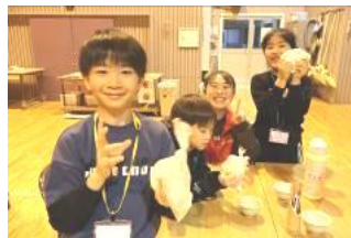
翌日に向けてピザ生地作り。おいしい生地になるようみんな真剣！