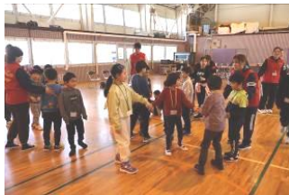
まずは、みんなで楽しくゲーム！