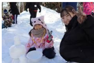
スノーランド作り！バケツなどを使って作った雪ブロックを重ね、雪のようせいやスノータワーを作りました。