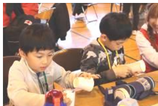
「まつぼっくりけん玉」を熱心に製作し、けん玉大会で大盛り上がり！