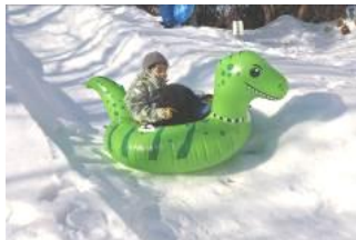
みんな「そり遊び」に夢中。「雪上運動会」も元気いっぱい楽しみました。