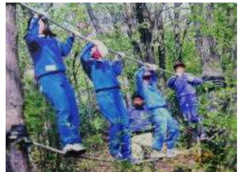
〈つなわたりの様子〉

起伏にとむ森林コースをサインに従って歩き、13の関門を回りながらビンゴゲームを楽しむ活動です。