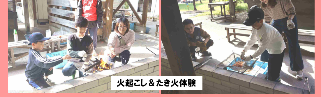
火起こし&たき火体験

学 野外活動体験ブースⅠとして「火起こし&たき火体験」を開設しました。メタルマッチでの着火に苦戦する家族も見られましたが、見事に全家族が火起こしに成功しました。最後に、キャンプの定番おやつ「スモア（チョコと焼いたマシュマロをクラッカーでサンドしたもの）」を家族でおいしくいただきました。