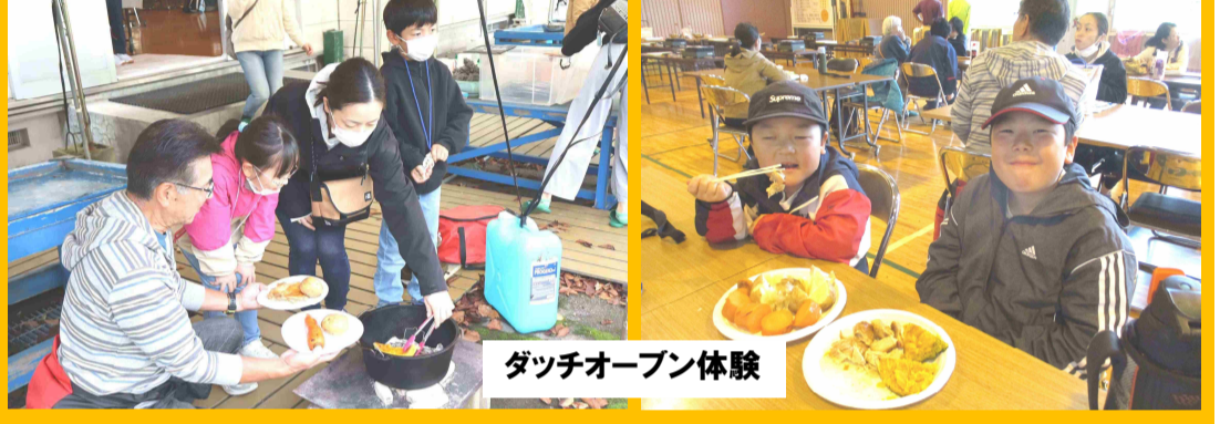
ダッチオープン体験

食 「食」ブースは3種類の体験を行いました。「ダッチオープン体験」では、皮がパリッとおいしい「鶏モモと野菜のロースト」を。「スキレット体験」では甘い匂いに食欲を刺激されながら「スキレットバナナケーキ」を家族で一緒に楽しく焼いて作りました。種差少年自然の家の協力のもと「南部せんべい焼」にも挑戦しました。