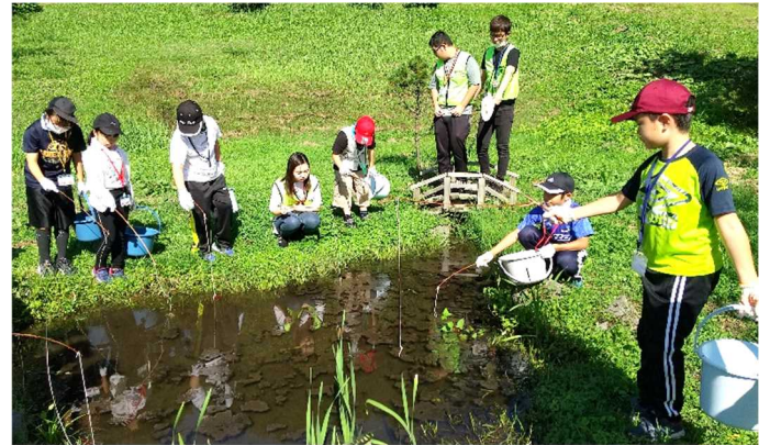
<ザリガニ釣りの様子>