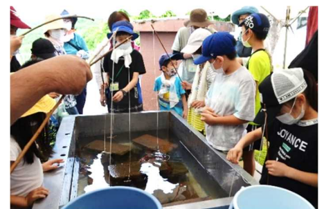
<体育館横テント下での活動の様子>