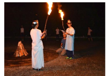
＜トーチサービスの様子＞

自然の中で火を囲み、儀式、歌、踊り等を行います。プログラムは団体の実情に応じて様々にアレンジを加えることができます。ゲームやスタンプなど各グループで考えた出し物を組み込むことにより、仲間との協力や親睦を深める活動です。