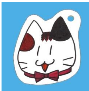
<油性マジックで色をぬったもの>