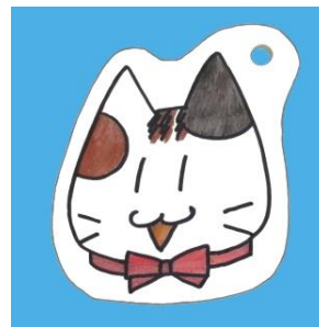
<色鉛筆で色をぬったもの>