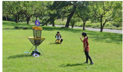
<フライングディスク入れゲーム>