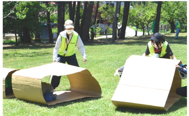
<ダンボールキャタピラリレー>

(7)指導 実施方法等について、自然の家職員が説明（直接または間接指導）を行う。