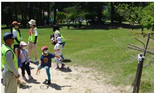
<ジャンボ輪投げゲーム>