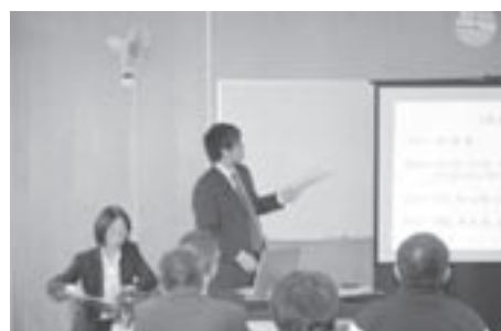
写真3 校内研修会(平成22年12月)