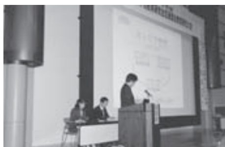
写真2 「研究発表キャリア教育推進のための学習指導」(平成22年10月)