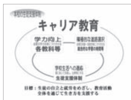
図1 本校の生徒支援体制