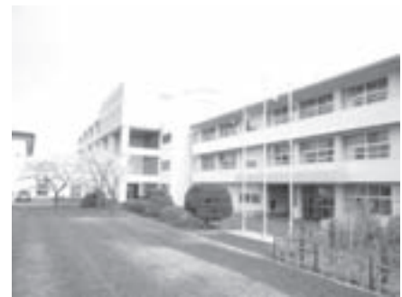
写真1 芝生のグラウンドと校舎

校舎は八戸市の中心部にあり、県内唯一の芝生のグラウンドを備えている。(写真1) また、北斗高等学校通信制の分室が同じ校舎の中にあるなど、県南の定通教育の拠点となっている。