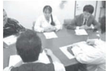
写真4 ケース会議(平成22年11月)

ア、イの面談の後、ケース会議を開催した。当該生徒と関連のある教員5名程度を招集し、30分以内という原則を設けて実施した。(写真4)短時間で多量の情報交換ができること、複数の教員が生徒の能力や長所・短所について情報交換することにより、多面的に生徒を捉えることができること、また、発達障害や精神疾患の有無にかかわらず、生徒の実態を適切に判断するために、このケース会議が有効であることがわかった。