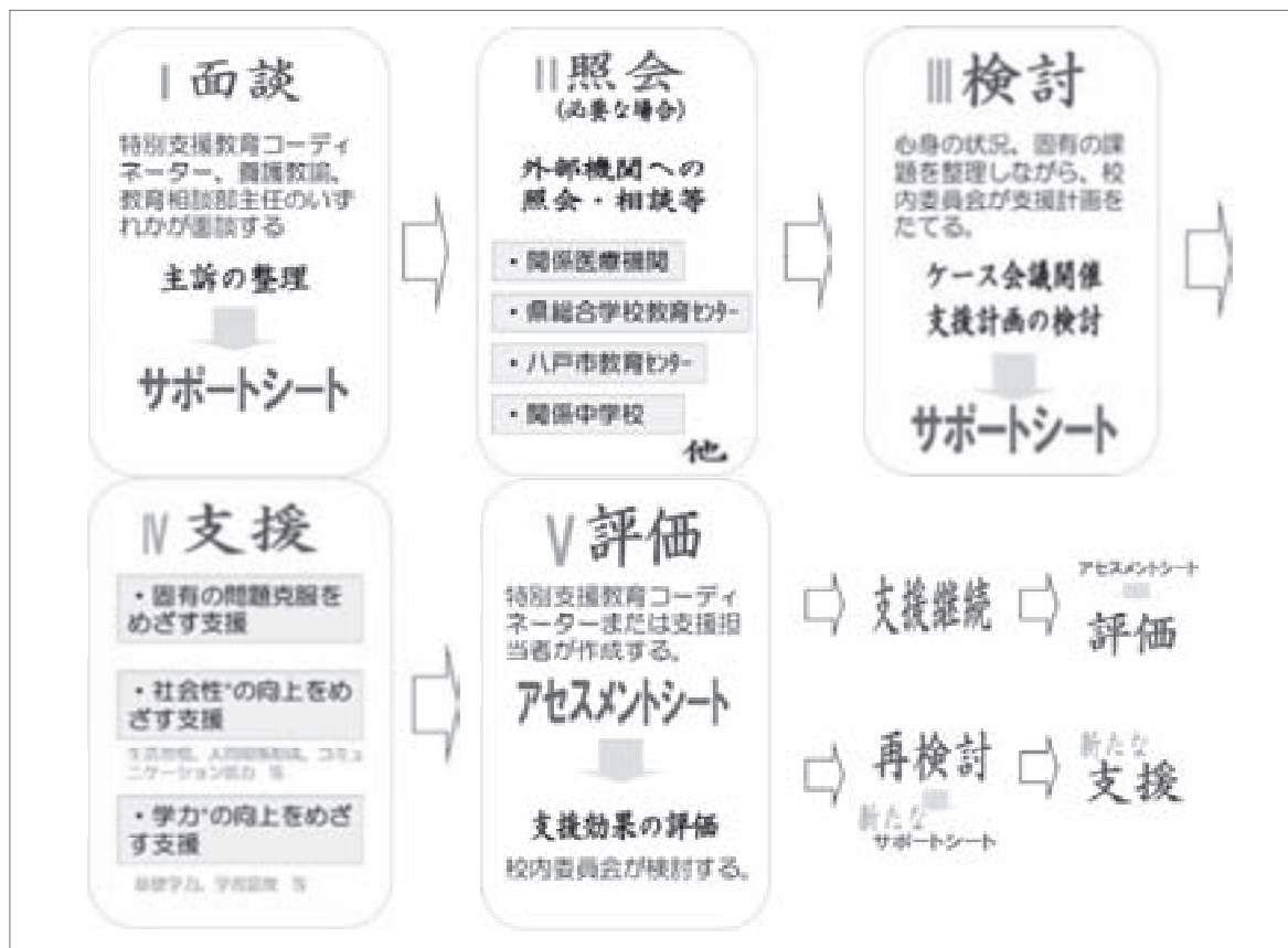
図2 学校生活支援委員会による支援（手順）