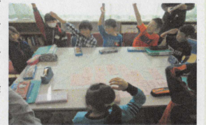
若葉小学校での研究発表会