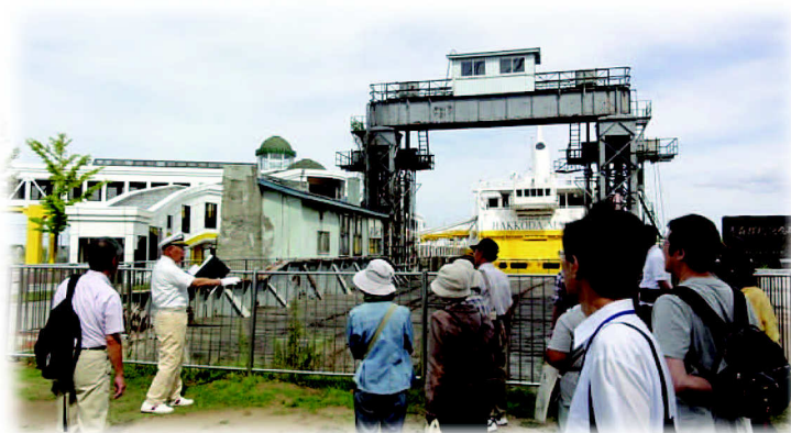
9月22日 青函連絡船メモリアルシップ八甲田丸前

郷土館では、9月15日（土）と22日（土）の2回にわたり、今年で4年目になる街歩きイベント「あもり街かど探偵団」を開催しました。15日は「かつての中心街を歩く」と題し、かつての繁華街である青森市本町周辺から新町・県庁に至るコースを歩きました。途中、武内製飴所・カネセ高橋かまぼこ店といった古くから続く商店や、旧日本勧業銀行の建物を利用している貸衣装店、孔雀苑に立ち寄り、それぞれの由来について学びました。この日は気象台の最高気温が33.9℃を記録する暑い日で、参加者の方々も、訪問先の方々も汗だくでした。