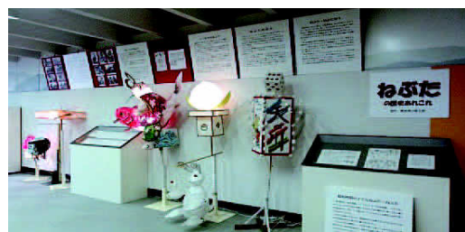
「ねぶた・ネプタ」展(7月)

今月（11月）からは、特別企画として2ヶ月にわたり「昔のくらし-手近な収納-」展を開催します。銭箱や提灯などコンパクトでアイデアあふれる暮らしの道具を紹介。1月からは第2弾として、「昔のくらし-暖房の道具-」展を開催。薪炭を使用するものから、電化以降のものまで、暖房に関する資料をあつめ、暖房の過去・現在・未来をみつめます。（増田 公寧）