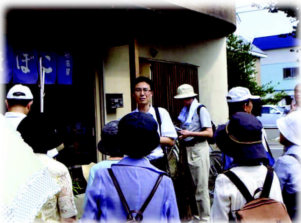
9月15日 カネセかまぼこ店前

22日の「交通と街並みの変遷を見る」では、海岸沿いのコースをとり、海運や鉄道に関係した遺構などをたどりました。この日訪問した本町カトリック教会・青森製氷・青函連絡船可動橋では、それぞれの施設を見学させて頂きました。