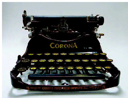
愛用のタイプライター コロナ社(アメリカ)製