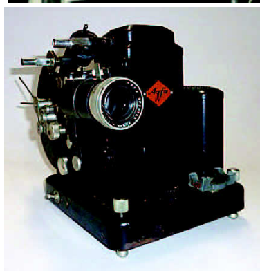
愛用の映写機 アグファ社(ドイツ)製