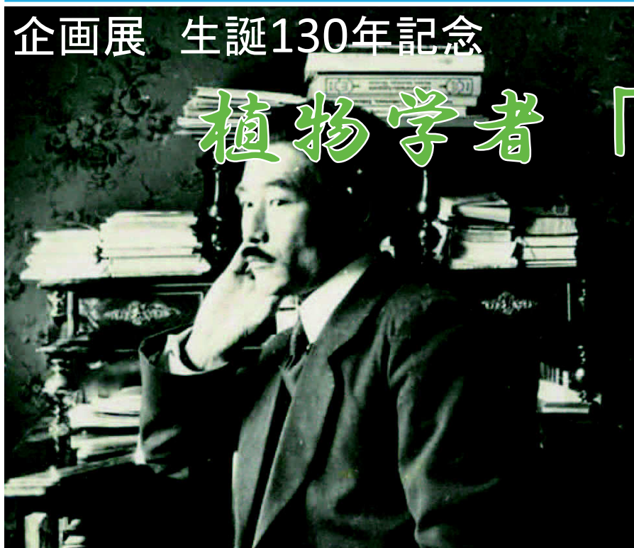
郡場寛(1920年 ベルリン)