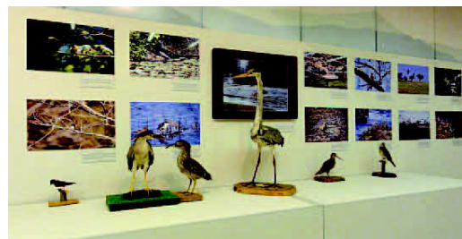
「去りゆく鳥たち」展(9月)