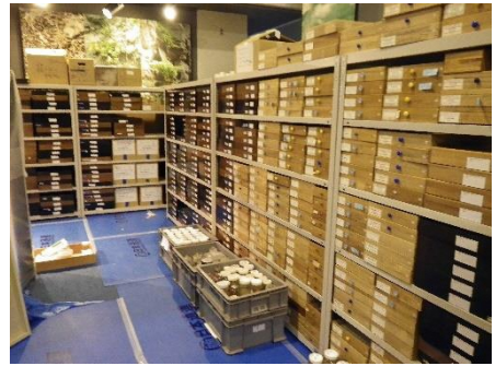
昆虫箱と液浸標本のガラス容器