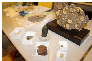
展示の日を待つ化石