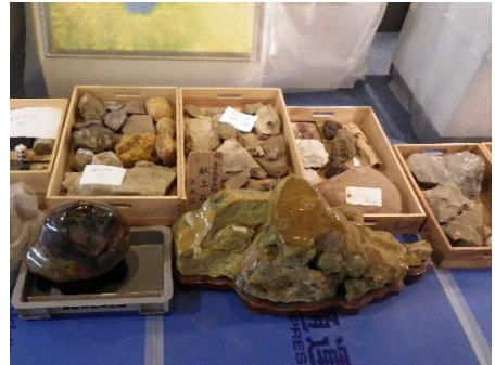
重さ20kg以上の岩石標本