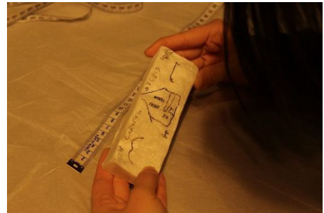
（写真1）破片に描かれたスタジオ