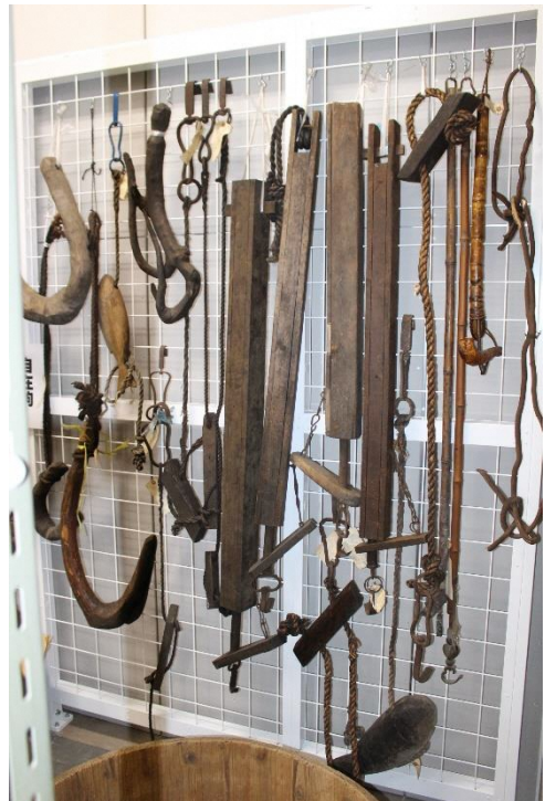
さまざまなかたちをした自在鉤