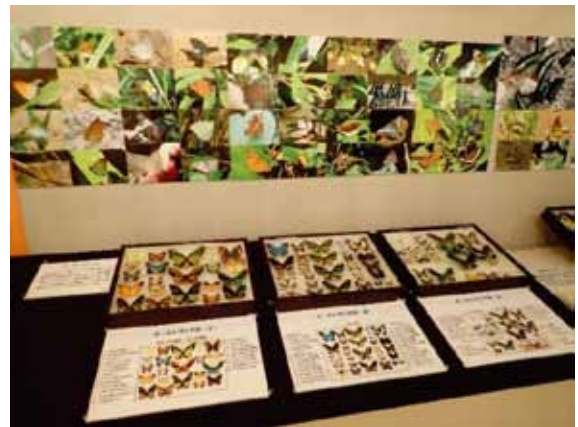
「世界のチョウ」展示コーナーの一部