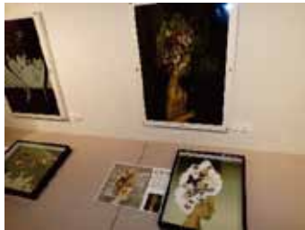
宇一の絵「少年の日の佛陀」と再現した標本

鷹山宇一記念美術館からお借りした作品は、生涯にわたり蝶を描き続けた宇一の絵画8点(複製写真)と、それらの絵を実際の蝶を使って再現したもののセットでしたが、そのユニークな手法に、来館者は食い入るように見入っていました。