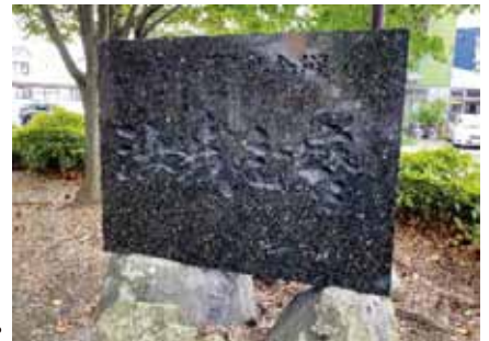
長島小学校創学100年記念の石碑 (棟方志功揮毫の「汝我志磨(ながしま)の文字を刻む」)