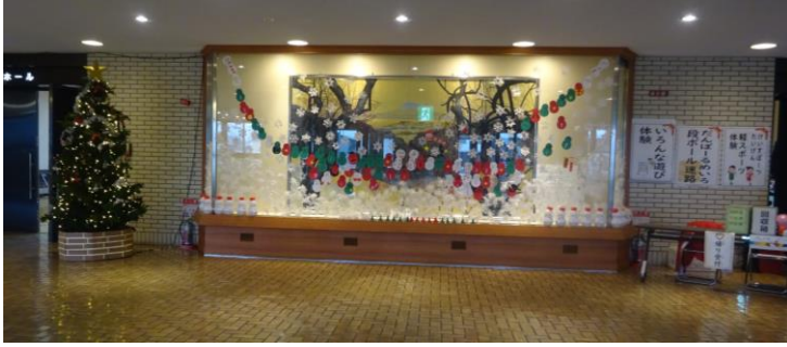
玄関ロビー・受付