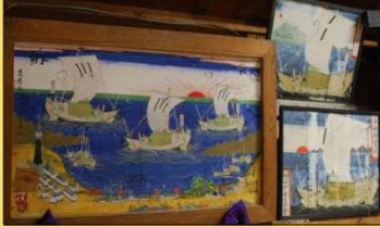
【鯉ヶ沢町・白八幡宮絵馬群】