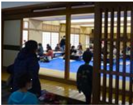
昼食・休憩コーナー