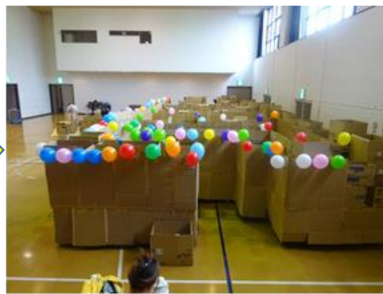
段ボール迷路完成

今回の子どもフェスティバルはコロナ禍のため4年ぶりの開催となった。今年度初めて、4月に開催していたものを12月のクリスマスに合わせて開催したが、クリスマスツリーや電飾、クリスマスソングのBGMを流すなど、クリスマスの雰囲気を楽しめるイベントとなった。