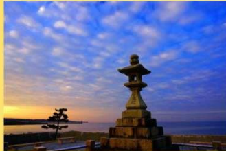
【野辺地町・浜町の常夜燈】