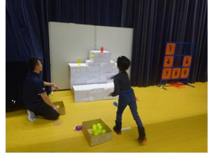
いろいろな遊び1階