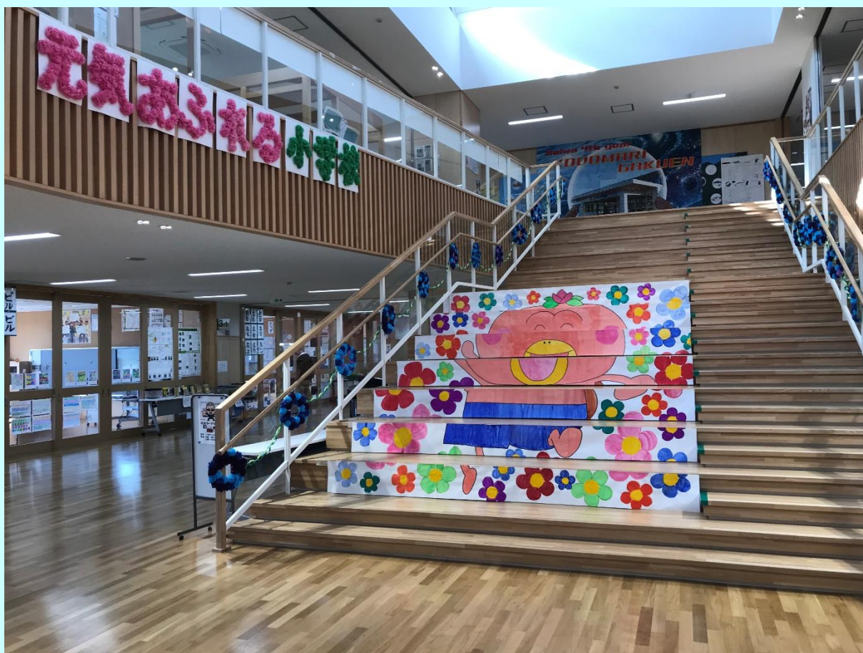
なかどまり町民文化祭（小泊会場） 10月14日（土）・15日（日） こだまり学園