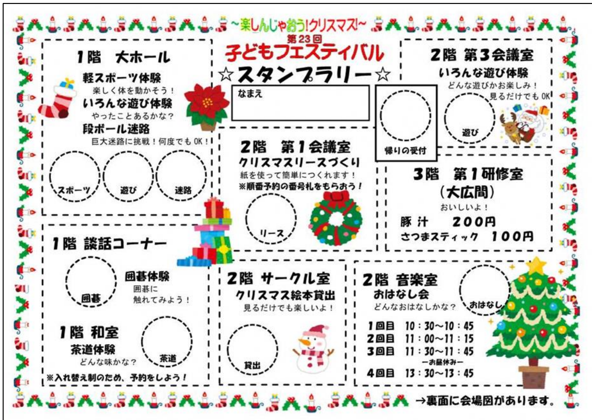
スタンプラリー用紙