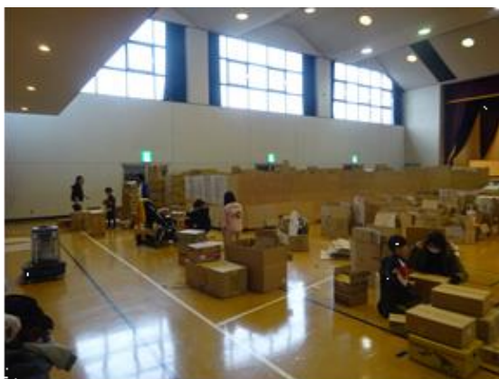
段ボール迷路製作

準備段階では、段ボールを集めるため病院やドラッグストアに協力をお願いして回った。迷路に適した大きさの段ボールを集めるのは時間がかかった。10月ごろから集め始め、結果的には十分すぎるくらいの段ボールを集めることができた。迷路の製作には半日かかったが、次回作ることがあるなら、迷路の形そのものを変えるなどし、もっと効率的に作る方法を見出したい。