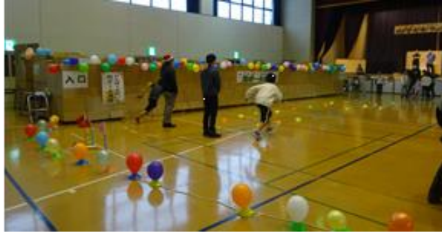
手前が軽スポーツ、奥が段ボール迷路