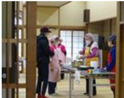
豚汁・さつまスティック販売