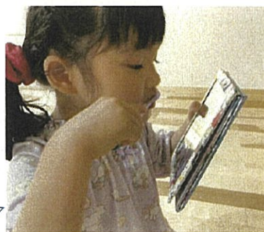
→写真右 手鏡を使った歯磨き