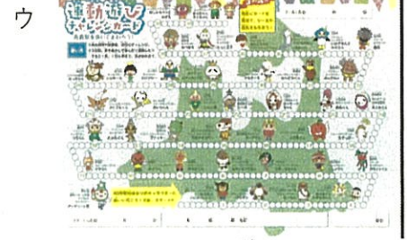
運動遊びチャレンジカード