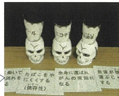
→写真右 たばこの有害性を 伝える工夫