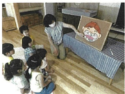
←写真左 歯磨き指導のための紙芝居