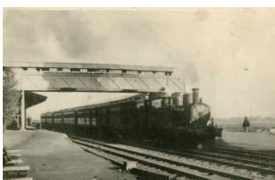
(絵はがき)弘前停車場ヨリ汽車進行ノ景