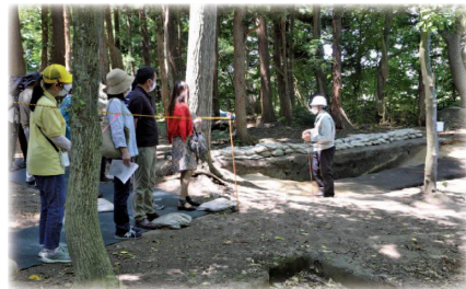
発掘調査現場公開の様子