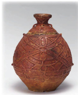
赤彩切断壺形土器 (重要文化財)

この特別展は、世界遺産「北海道・北東北の縄文遺跡群」の構成資産をはじめとする、4道県の遺跡の出土品をとおして、縄文時代の生業や、祭祀・儀礼について解説するとともに、縄文遺跡群の価値や魅力について紹介します。